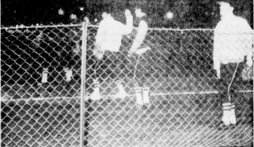
PRATIQUE — Les Reds de Drummondville, de la Ligue de Fast-ball inter-cité, ont commencé à pratiquer. On en voit ici quelques-uns qui se "déroillent" les bras en lançant la balle. L'ouverture officielle de la saison aura lieu ce soir, au parc Ferland, rue Ringuet, à Drummondville, à compter de 8 h. 30 p.m.