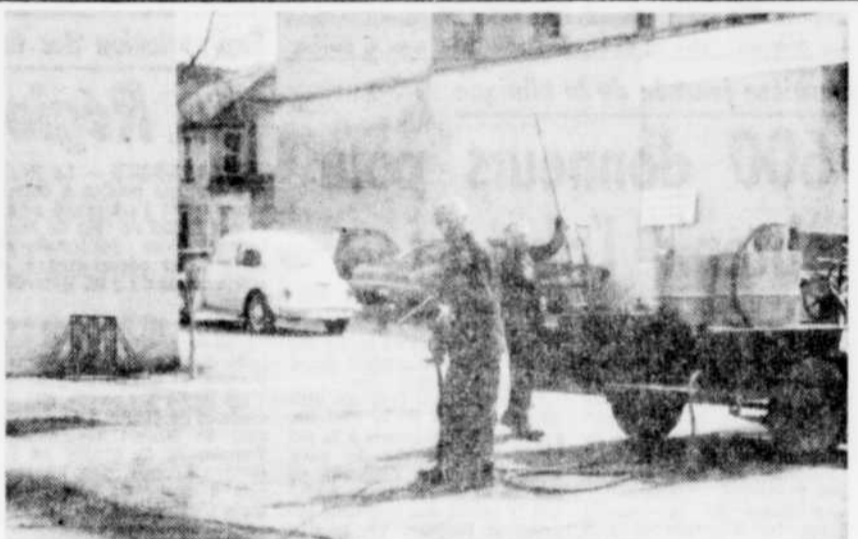
AU TRAVAIL — Les employés municipaux de Drummondville se sont affairés, hier, dans les rues de la cité, à nettoyer les artères. D'autres ont travaillé à boucher quelques trous, notamment sur les rues Brock et Lindsay. Comme le mentionnait l'un des employés, "on répare le terrain de golf".