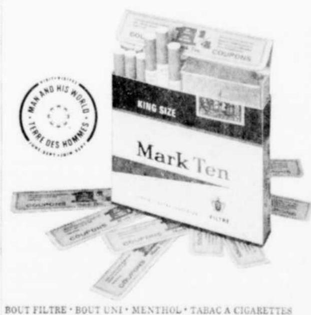
BOUT FILTRE • BOUT UNI • MENTHOL • TABAC A CIGARETTES

Ce boni vaut 100 coupons supplémentaires, s'il est accompagné d'au moins 250 coupons Mark Ten ordinaires. Valable jusqu'au 31 déc. 1974.