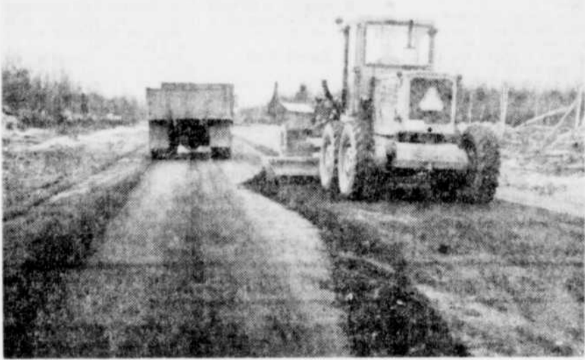
VERS LE RECOUVREMENT D'ASPHALTE — La machinerie lourde prépare actuellement la partie de la "grande ligne" non pavée encore à recevoir, d'ici peu, sa couche de béton bitumineux. Lorsque le projet sera complété, les automobilistes de Victoriaville ne seront plus qu'à dix milles seulement de la route Transcanadienne.

VICTORIAVILLE (ML) — Toutes les municipalités des Bois-Francs seront invitées à se joindre au comité de la route Transquébécoise de la Chambre de commerce de Victoriaville, mercredi prochain, alors qu'il sera l'hôte du sous-ministre de la Voirie, M. Maurice Ostiguy. Compte tenu du court délai mis à la disposition des promoteurs, une lettre circulaire sera expédiée des aujourd'hui aux municipalités. Ce message urgent prie les conseils municipaux de former des délégations. C'est l'importance de la construction de la route Transquébécoise pour notre région, qui a fait envisager de nouvelles démarches auprès du ministère par le comité de la Chambre locale. Conscient de la vocation régionale du projet, on n'a donc pas hésité à demander l'appui de tous. Les membres de la délégation sont priés de se présenter à Québec mercredi, le 21 mai courant, à compter de 10h30, au bureau du député Roch Gardiner, chambre 340. Le président, M. Vallière, a précisé, au moment de la préparation du message à transmettre: "Si nous voulons un réseau routier adéquat, nous devons en établir les conditions qui seraient notamment de faciliter l'établissement de nouvelles industries, augmenter la rapidité des échanges et, par conséquent, le développement général de la province".