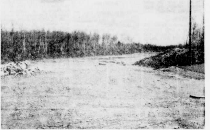
LE RESEAU ROUTIER S'ACCROIT , au domaine Baril de St-Louis de Blanford, sis le long de la route Transcanadienne. On voit que l'usine de caravanes Val-Bar est déjà en place sur ce parc industriel et résidentiel, en plus d'une dizaine de maisons unifamiliales. D'autres industries viendront très bientôt s'y installer, tandis que le secteur résidentiel continuerait de se développer.