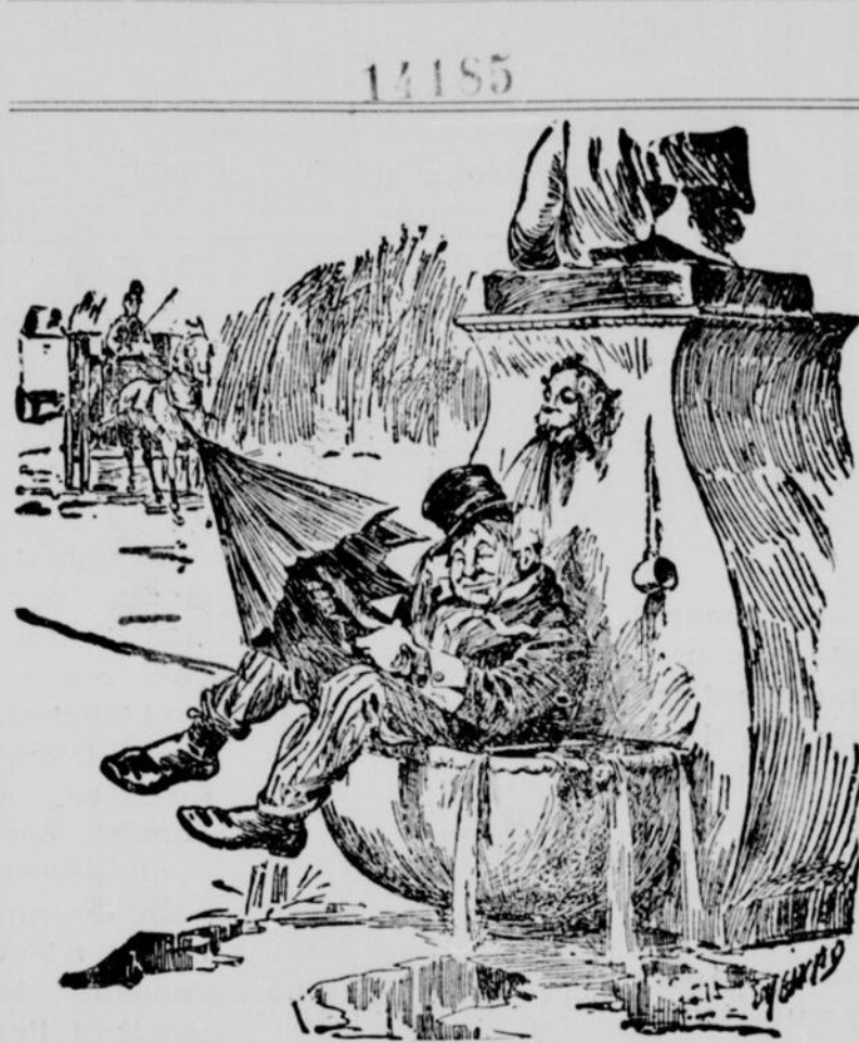
TROP D'EAU ET TROP DE VIN. —Hein ! J'avais bien dit que le temps changerait. J'ai joliment bien fait d'emporter mon parapluie.