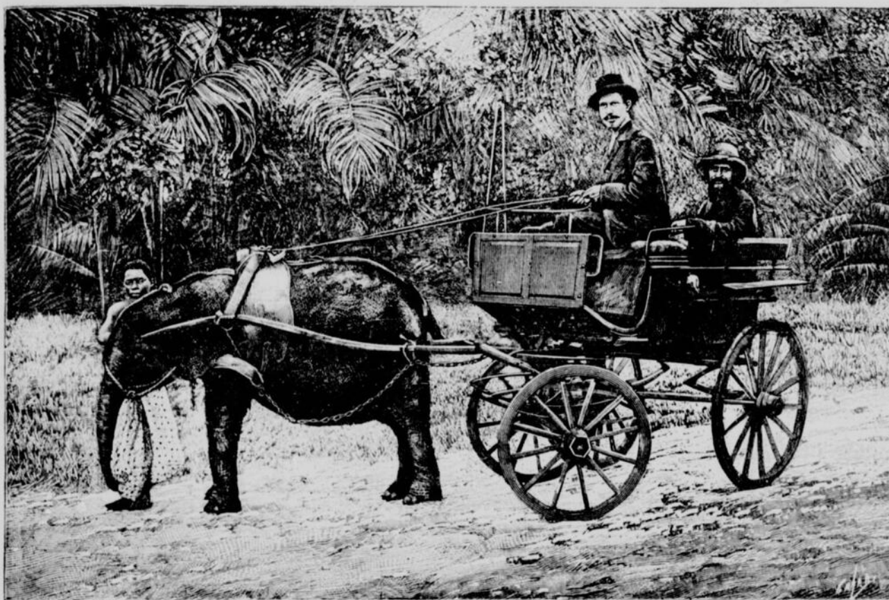
Le premier éléphant africain domestiqué