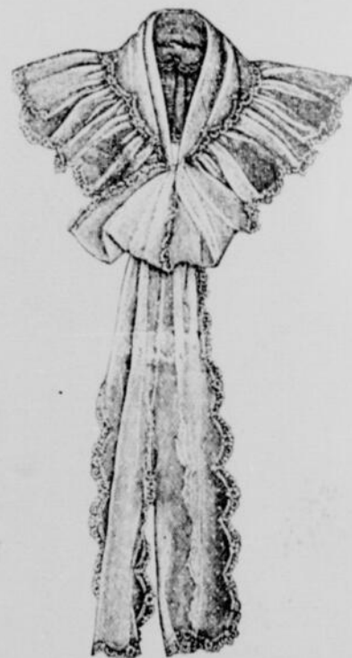
Fichu avec garniture-volant

Mayonnaise. —Mettez dans un bol deux ou trois cuillerées de moutarde, sel, poivre et un filet de vinaigre. Versez de l'huile, goutte à goutte, en tournant la moutarde avec une cuillère de manière à bien l'émulsionner avec l'huile. On met plus ou moins d'huile, suivant qu'on aime cette sauce plus ou moins forte au goût. Quelques personnes mêlent à cette sauce, échalotte, persil, ciboule, le tout haché très fin.