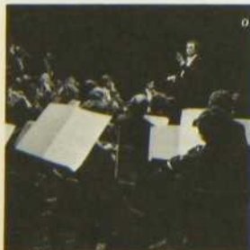
L'Oiseau de feu

Drame réalisé par David Greene, d'après le roman d'Alex Haley. Avec Levar Burton, Edward Asner et Ralph Waite (2e de 6). Kunta Kinte et ses frères de sang sont transportés en Amérique. Ils tentent de se révolter. Le manque d'hygiène et la répression déciment leurs rangs. Ils débarquent le 29 septembre 1767. Le maître de Kunta Kinte confie son nouvel esclave à Violon, qui a la charge de lui apprendre à obéir et à travailler dans la plantation. Kunta progresse vite dans l'apprentissage de la langue, mais ne peut admettre ni ses chaînes, ni son nouveau nom qu'on lui a imposé, Toby.