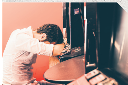
Gratuit, confidentiel, partout au Québec

PROBLÈME DE JEU EXCESSIF ? Un programme d'aide téléphonique accessible partout à distance