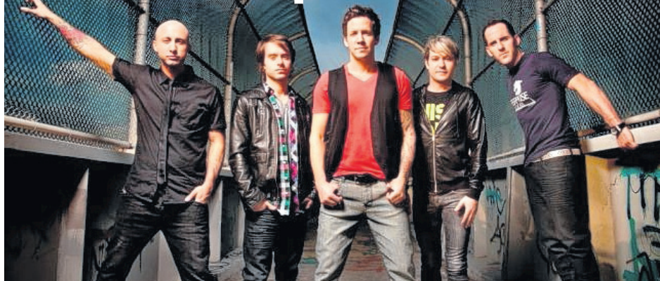
Simple Plan promet d'enflammer la scène lors de son passage au Festival Éole en musique.

SPECTACLE. Le groupe international de musique pop rock Simple Plan s'arrêtera à Matane le 12 août prochain. Simple Plan fera ainsi partie de la programmation de la 8e édition du Festival Éole en musique de Matane.