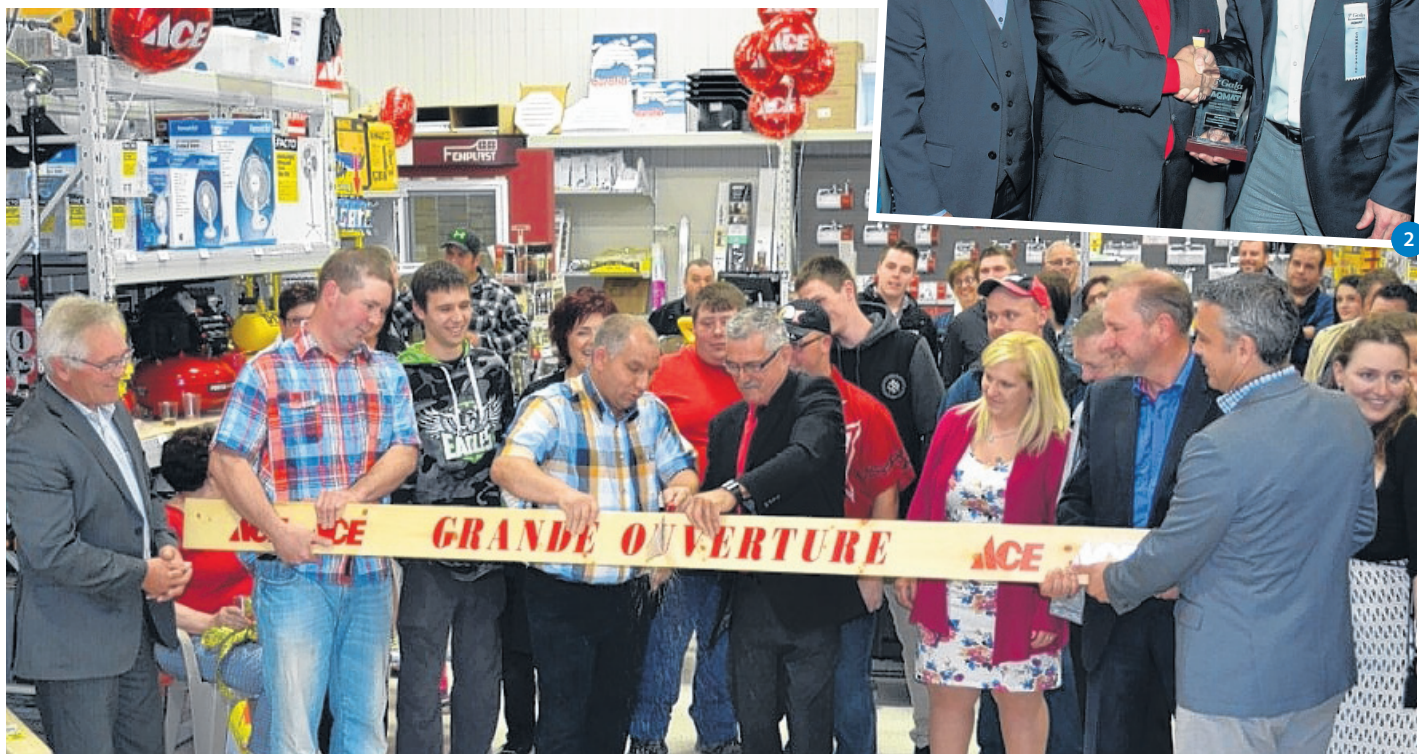
L'équipe de la quincaillerie Armand Dumaresq lors de l'annonce de leur affiliation au géant de rénovation, Ace Canada.

Après 27 mois à la tête du magasin situé à Rivière-au-Renard, le chiffre d'affaires a plus que quadruplé. « Oui, l'amélioration du chiffre