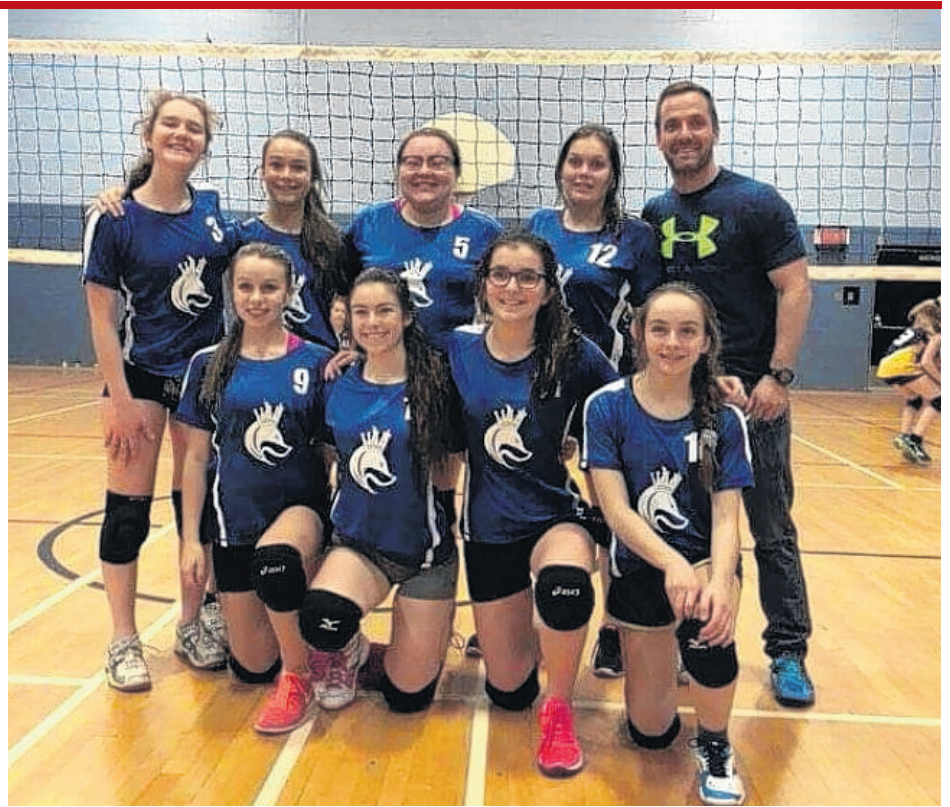
L'équipe cadette de Rivière-au-Renard.

De leur côté, les cadettes de l'école Antoine-Roy de Rivière-au-Renard ont conclu le tournoi avec une fiche de 4 victoires et 4 défaites, pour terminer une deuxième fois au 3e rang de leur section. Les juvéniles ont quant à elles remporté leur premier match au total des points grâce à une belle performance face aux benjamines de Gaspé. Rivière-au-Renard en était à sa première saison dans le Réseau du sport étudiant de l'Est-du-Québec. Les 40 équipes du Réseau ainsi que les formations des Îles-de-la-Madeleine se déplaceront convergeront à Gaspé du 17 au 19 mars pour le championnat régional.