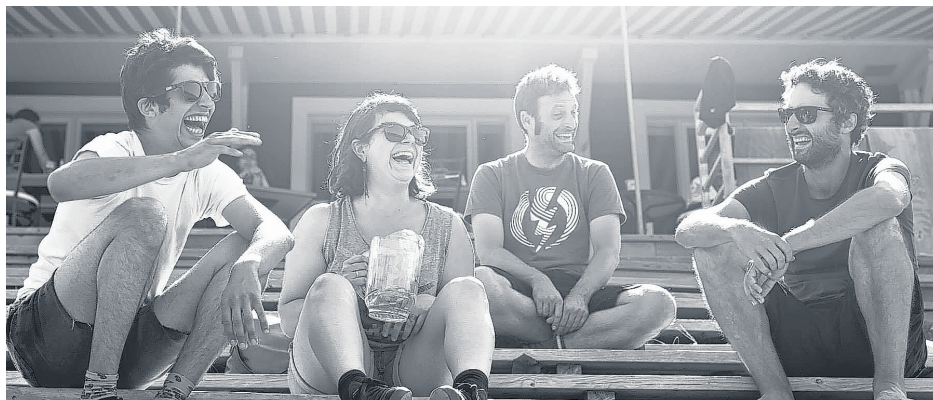
On souhaite que la Destination Chanson Fleuve devienne un incontournable pour la relève musicale au Québec.

L'addition de Québec permettra aux 8 auteurs-compositeurs-interprètes sélectionnés de monter sur scène dans la capitale nationale et de bénéficier d'ateliers de perfectionnement et de professionnalisation. Les chansonneurs auront donc droit à une foule d'activités pour parfaire leur art en plus de côtoyer des artistes établis prêts à les appuyer. Au Festival en chanson de Petite-Vallée, on espère que ce vaste parcours d'apprentissage musical devienne pratiquement un passage obligé pour les artistes de la relève.