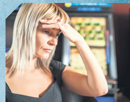
Gratuit, confidentiel, partout au Québec

PROBLÈME DE JEU EXCESSIF ? Un programme d'aide téléphonique accessible partout à distance