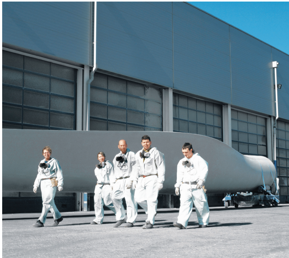
L'usine LM Wind Power de Gaspé poursuivra ses embauches au cours de la prochaine année avec l'objectif d'atteindre les 450 travailleurs.

L'étude a démontré que l'industrie éolienne demeurait confiante, alors que parmi les 40 entreprises sondées, 81 % prévoient une stabilité ou une croissance de leurs activités au cours des prochaines années, ce qui représente une hausse de 6 % par rapport au sondage effectué l'an dernier. Les entreprises ayant des