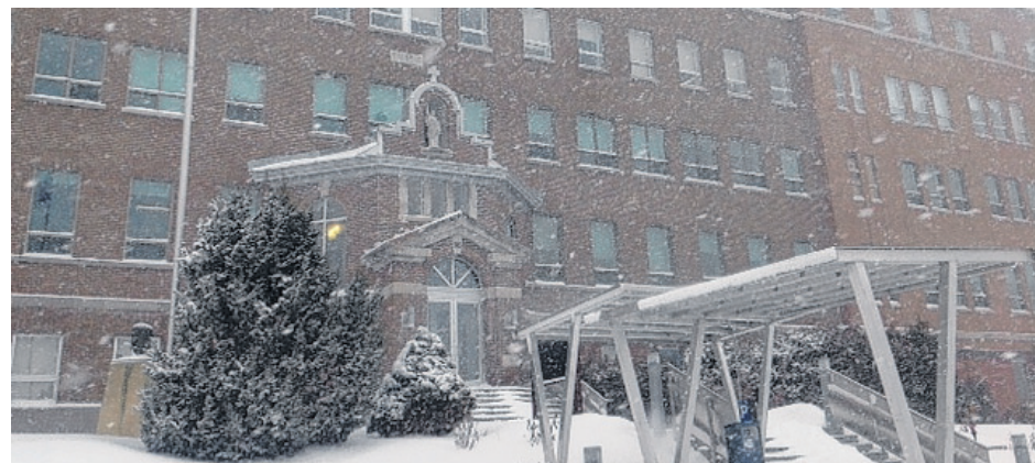
Des affiches de sensibilisation contre les violences à caractère sexuel ont déjà fait l'apparition dans les différents campus du Cégep de la Gaspésie et des Îles.

membres du personnel ayant des contacts réguliers avec les étudiants suivront une formation afin de pouvoir agir en tant qu'intervenant. « Nous désirons que notre personnel sache reconnaître les signes et puisse offrir une écoute active aux étudiants vivant une situation difficile. » (D.F.)