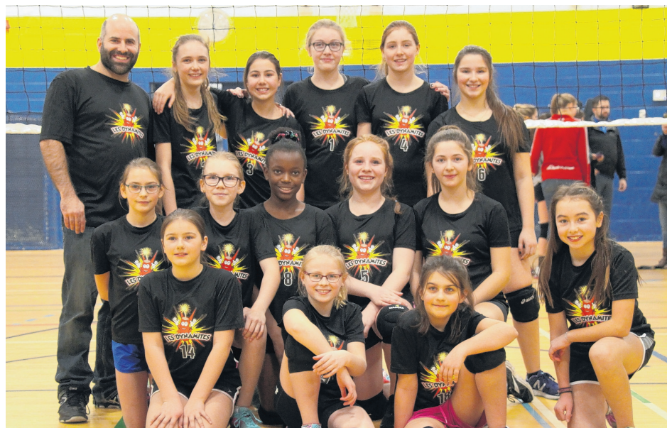
Les Dynamites de Gaspé ont réussi à offrir de bonnes performances malgré leur jeune carrière.