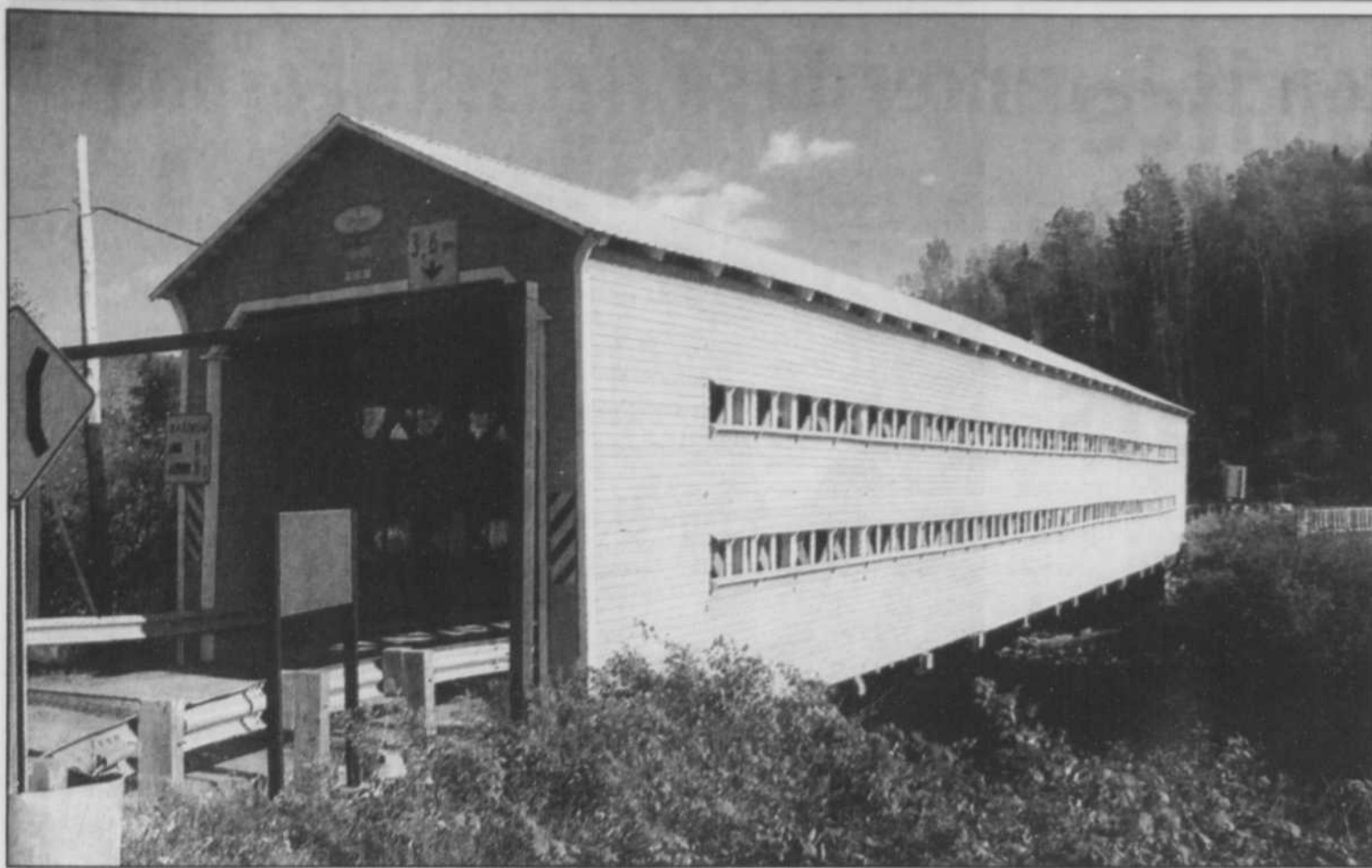
LE NOUVELLISTE: ANDRÉ MERCIER