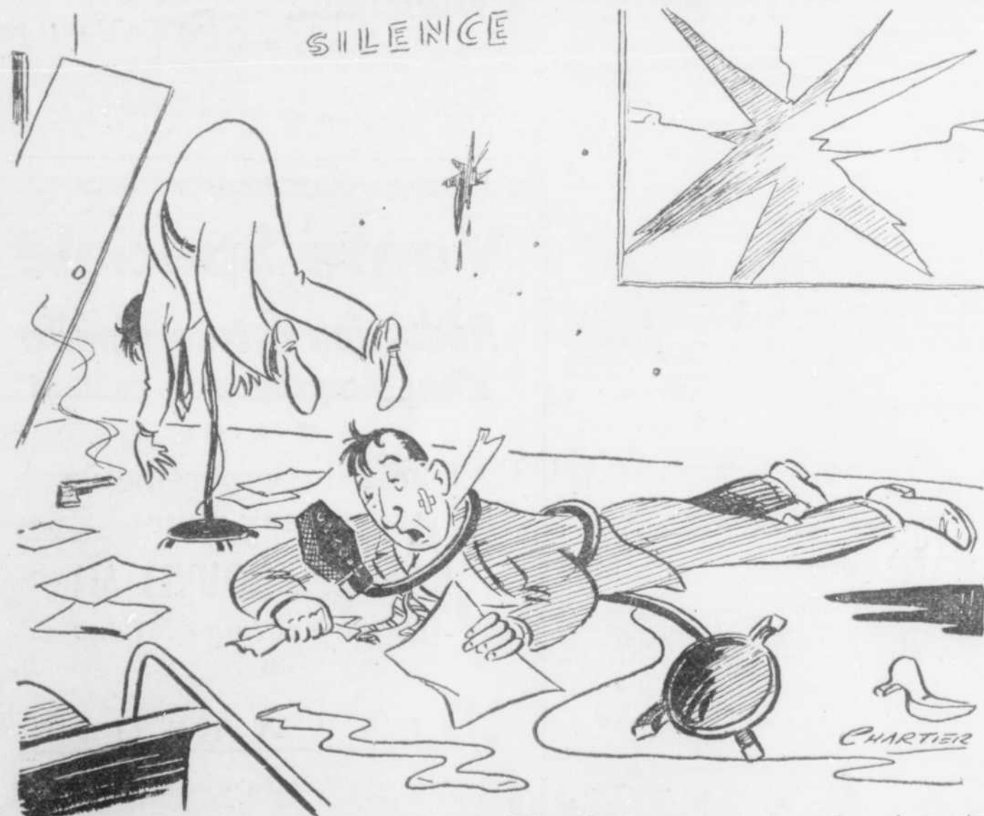
« Je suis un criminel », une dramatisation de Ernest Palascio-Morin, vous reviendra... la... la semaine prochaine à... à la même heure ».

Le seul périodique consacré exclusivement aux artistes de la radio