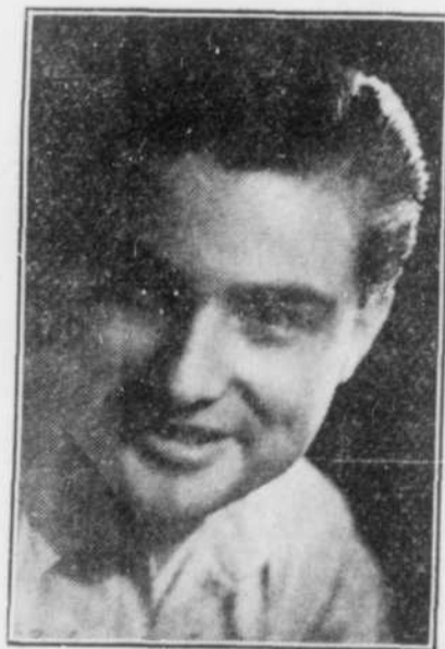
JEAN-PAUL JEANNOTTE ténor (Montréal)