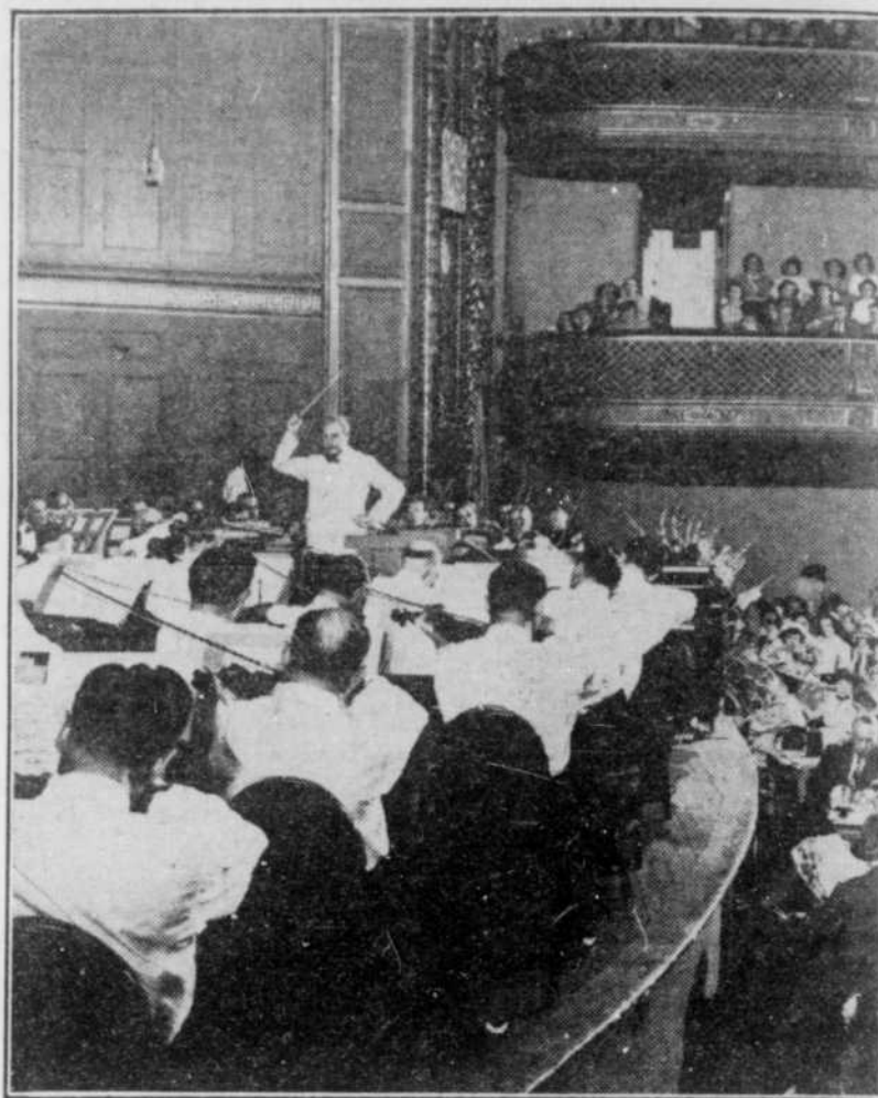
Depuis plus de vingt ans les célèbres concerts de l'Orchestre Boston Pops, sous la direction d'Arthur Fiedler, ont connu une popularité remarquable. Les radiophiles canadiens auront l'occasion d'entendre cet orchestre de renom, mettant en vedette Robert Merrill, baryton, tous les dimanches soirs, sur le réseau Dominion de Radio-Canada, à partir du 12 décembre.