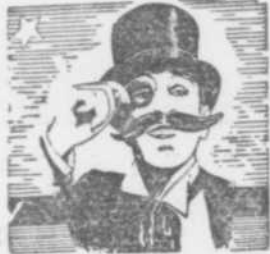
— PAR — L'ACADEMICIEN