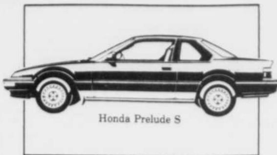
Honda Prelude S

Nous les avons toutes! Chaque Civic, chaque Accord, chaque Prelude filent avec nous dans des installations plus grandes, plus modernes. Voici enfin l'endroit tout désigné pour vous servir, vous et votre voiture Honda, dans le meilleur des mondes avec vue sur le XXI e siècle!