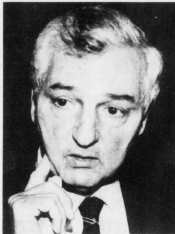
Paul Desmarais contrôle également un actif évalué à 16 milliards $.

ans, George Weston, il y a 106 ans, à Toronto. A sa mort, son fils Garfield promit: "Je ne t'offrirai pas un monument somptueux, mais je rendrai ton nom célèbre à