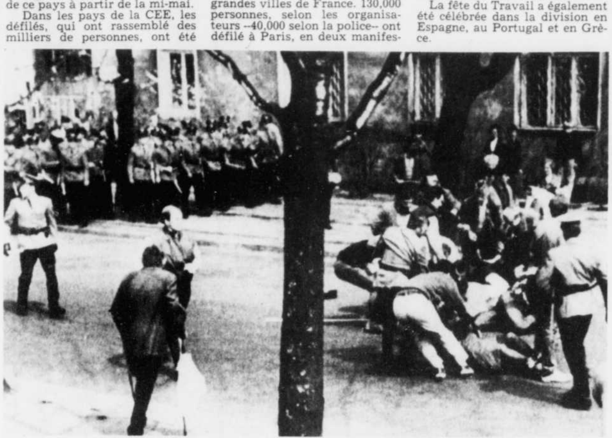
Des policiers en uniforme et d'autres en civil interviennent pour arrêter des manifestants à Varsovie, en Pologne.

tations distinctes, sous les couleurs des syndicats de gauche. 25,000 à 50,000 personnes ont par ailleurs défilé à Paris à l'appel du mouvement d'extrême-droite Front National pour célébrer la fête de Jeanne d'Arc (avancée d'une semaine) et manifester leur soutien à leur leader, M. Jean-Marie Le Pen.