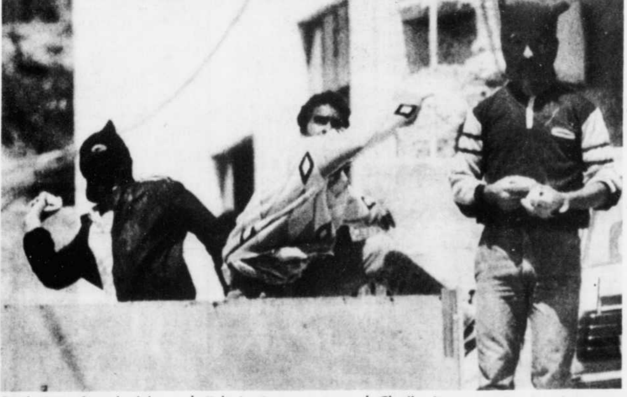
Pendant que des palestiniens se battaient entre eux au camp de Chatila, d'autres continuaient de harceler les soldats israéliens avec des pierres à Beit Zehour, dans les territoires occupés.