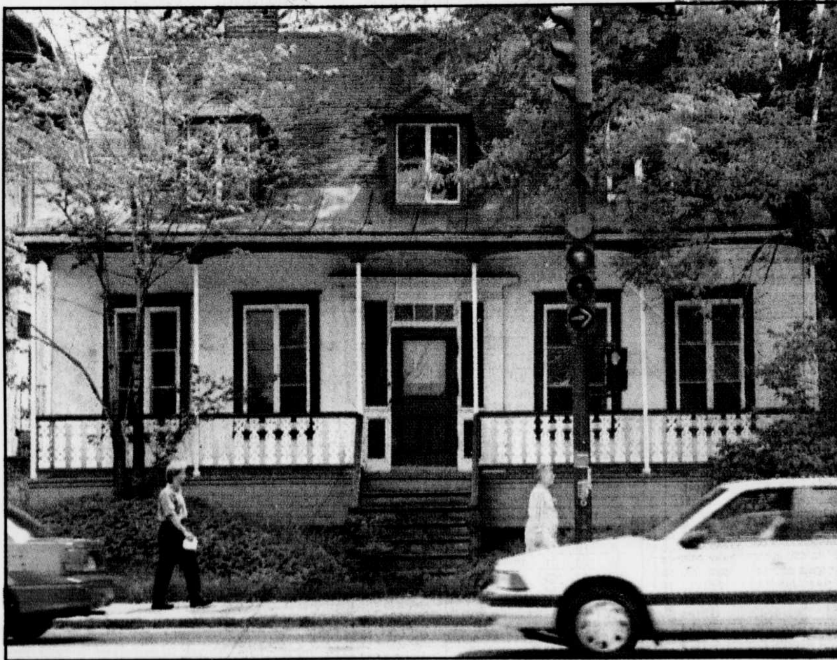
La maison Krieghoff sur la Grande-Allée.