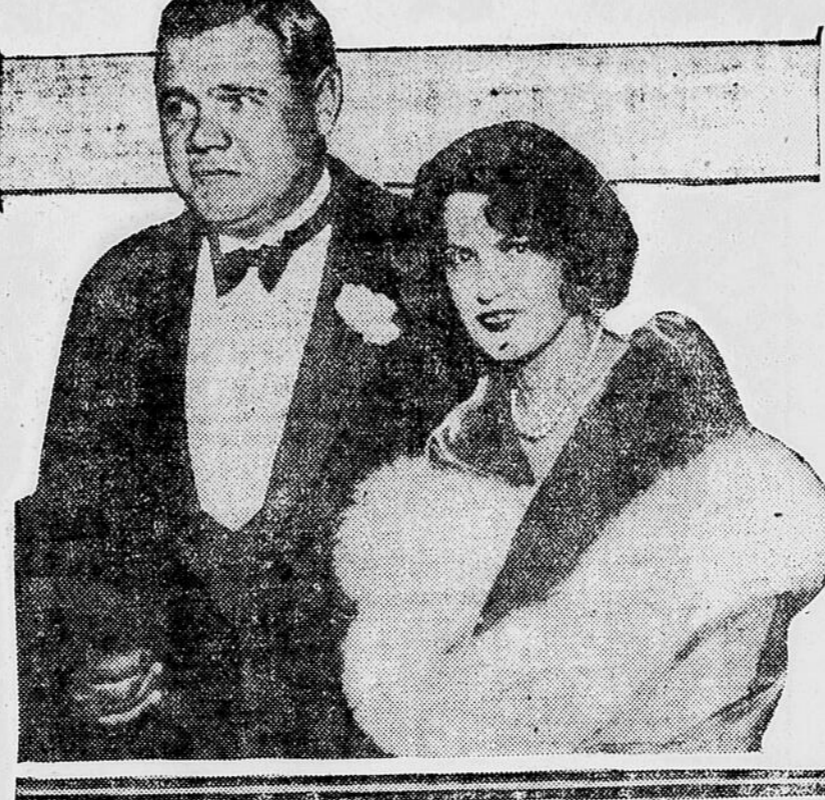
Le brillant Babe Ruth ne se ressemble pas ici avec l'habit. Il est en compagnie de sa femme, veuve Claire Hodgson, ancienne actrice, qu'il a épousée jeudi en l'église St-Gregoire de New-York.