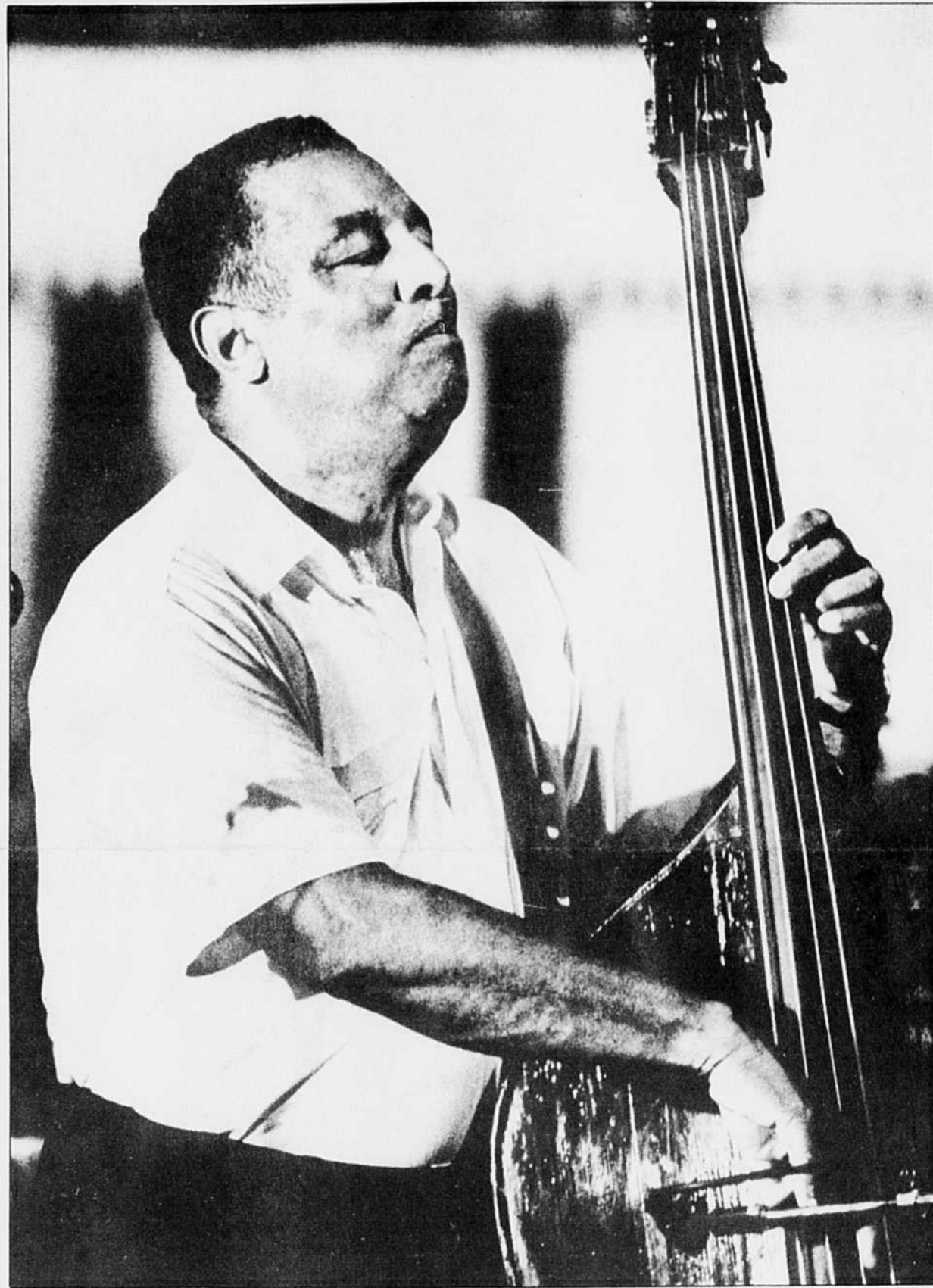
Ray Brown, le contrebassiste ayant participé au plus grand nombre d'enregistrements dans l'histoire du jazz, a donné hier le véritable coup d'envoi à la 12e édition du Festival international de jazz, à l'Église Saint-Jean-l'Évangéliste.

FESTIVAL INTERNATIONAL DE JAZZ DE MONTREAL