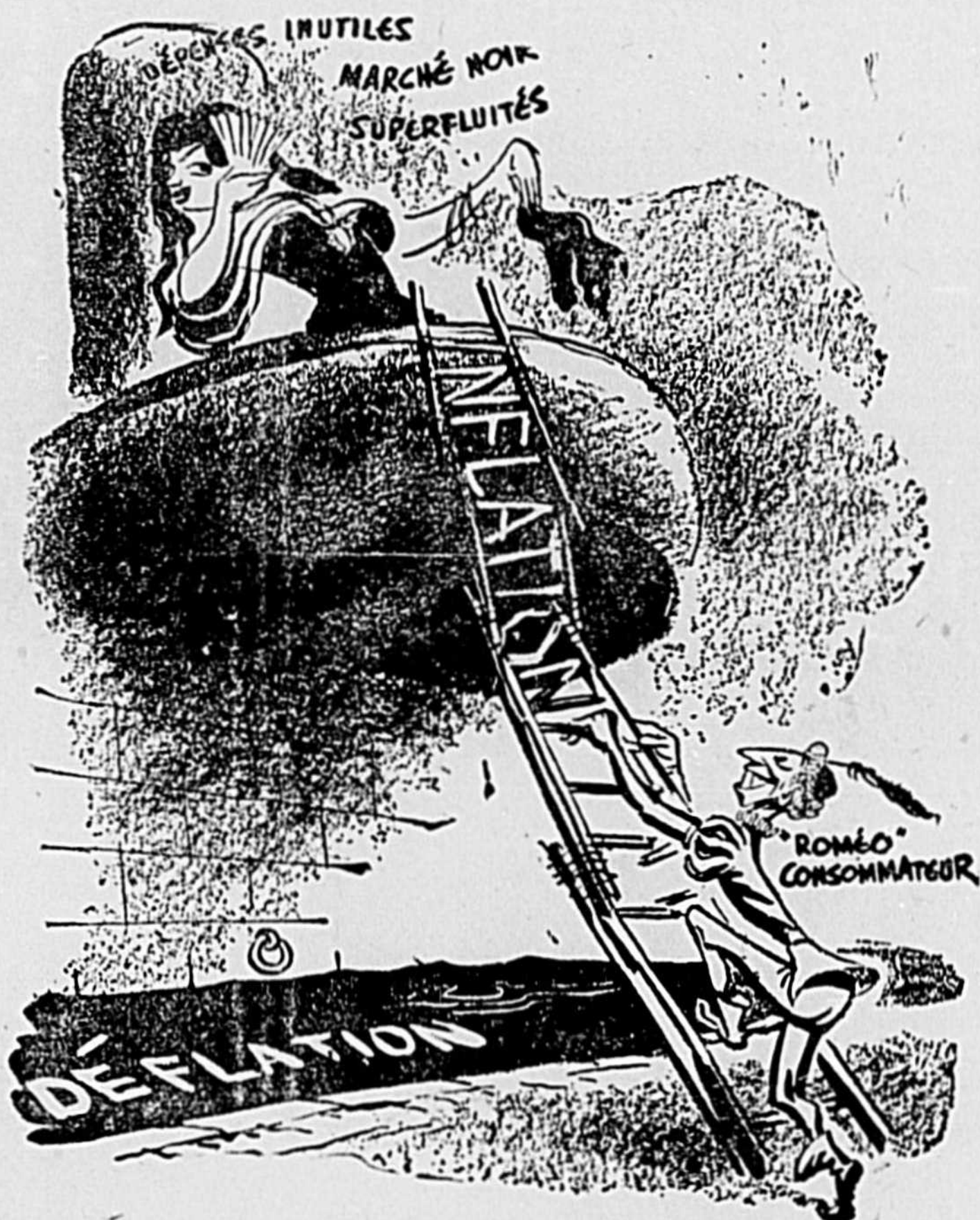
PRENDS GARDE, ROMÉO