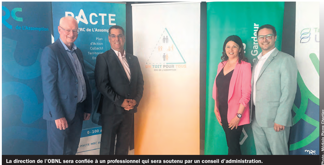
La direction de l'OBNL sera confiée à un professionnel qui sera soutenu par un conseil d'administration.

Je tiens à saluer la collaboration de toutes les municipalités et partenaires de la MRC de L'Assomption dans la création d'un Toit pour Tous MRC de L'Assomption. Un logement est plus qu'un toit au-dessus de sa tête. Cette annonce confirme donc l'engagement des élus d'offrir des logements