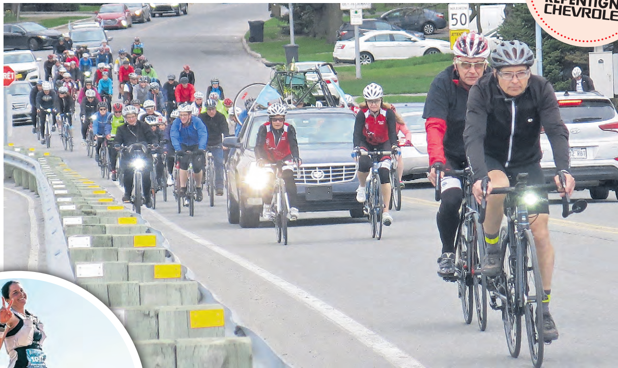
Voilà donc toute une 17 e édition du Tour du Silence de Repentigny.

Le TDS repentignois tiendra aussi un volet scolaire: le jeudi 16 mai en avant-midi les élèves de 4 e et de 5 e année de l'école Entramis feront leur propre défilé de 9 km, à petite vitesse; un arrêt est prévu au parc