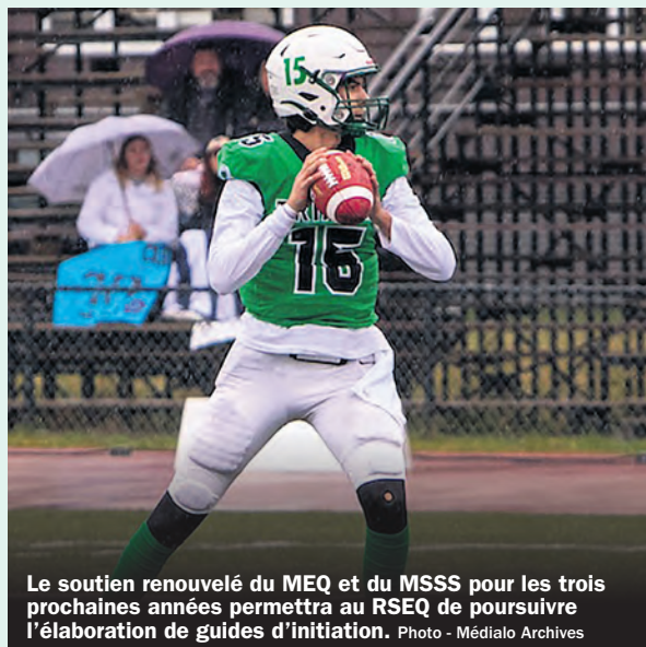
Le soutien renouvelé du MEQ et du MSSS pour les trois prochaines années permettra au RSEQ de poursuivre l'élaboration de guides d'initiation.

Mené par le RSEQ, IN MOVEO vise à faire découvrir aux élèves du secondaire, grâce à une tournée des écoles, le plaisir de bouger toute l'année en leur proposant des activités de découverte et d'initiation à plusieurs disciplines sportives. Ce projet a d'abord été financé par le ministère de l'Éducation (MEQ) dans le cadre de la mise à jour économique 2021 et fait partie intégrante du Plan d'action interministériel en santé mentale (PAISM) 2022-2026 - S'unir pour un mieux-être collectif.