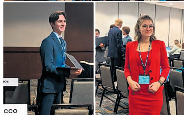
Les quatorze étudiants du Cégep à L'Assomption avaient le mandat de représenter le Maroc.