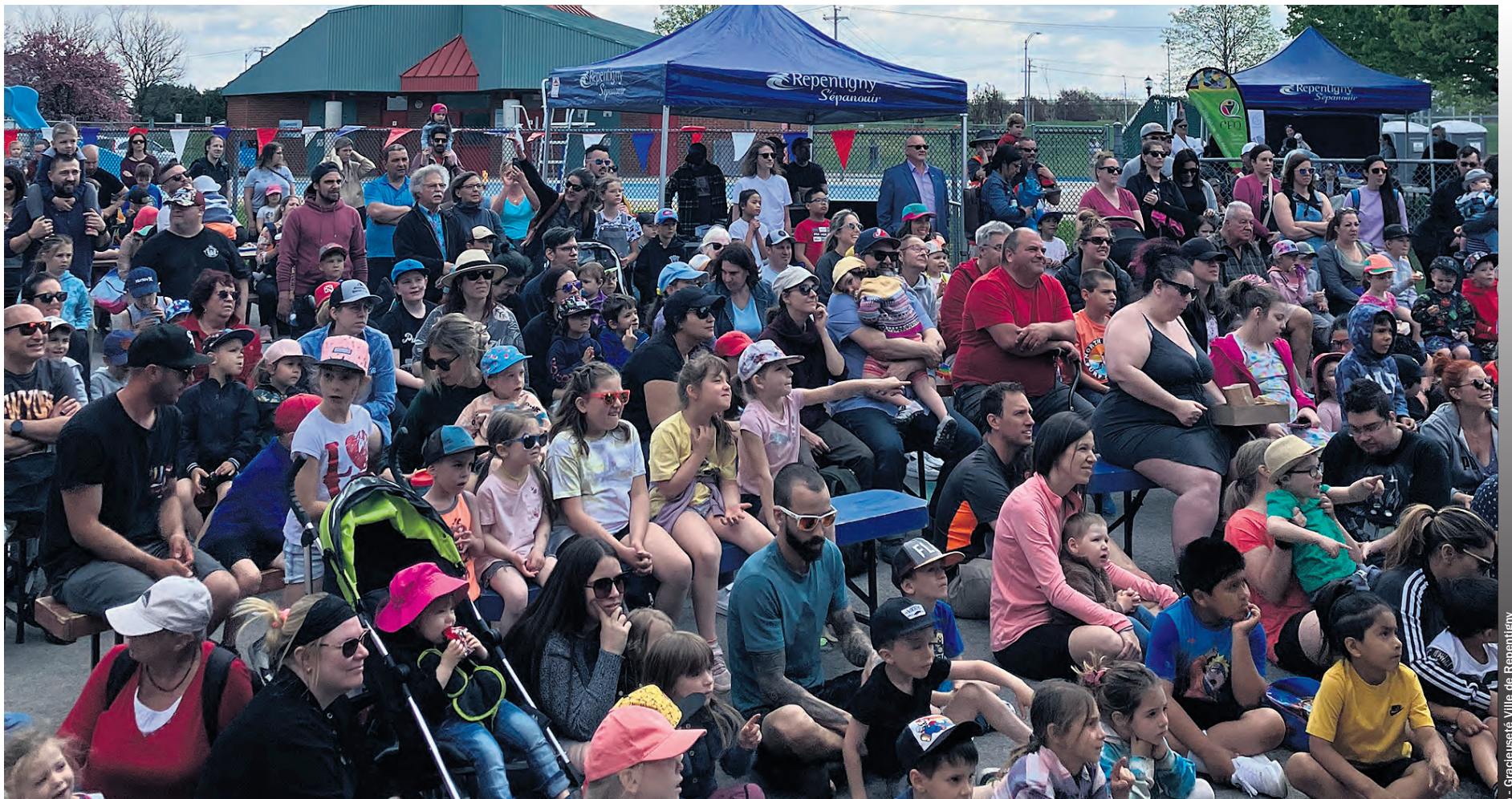
L'événement phare de cette semaine thématique est la Fête des familles qui revient pour une 9 e année.