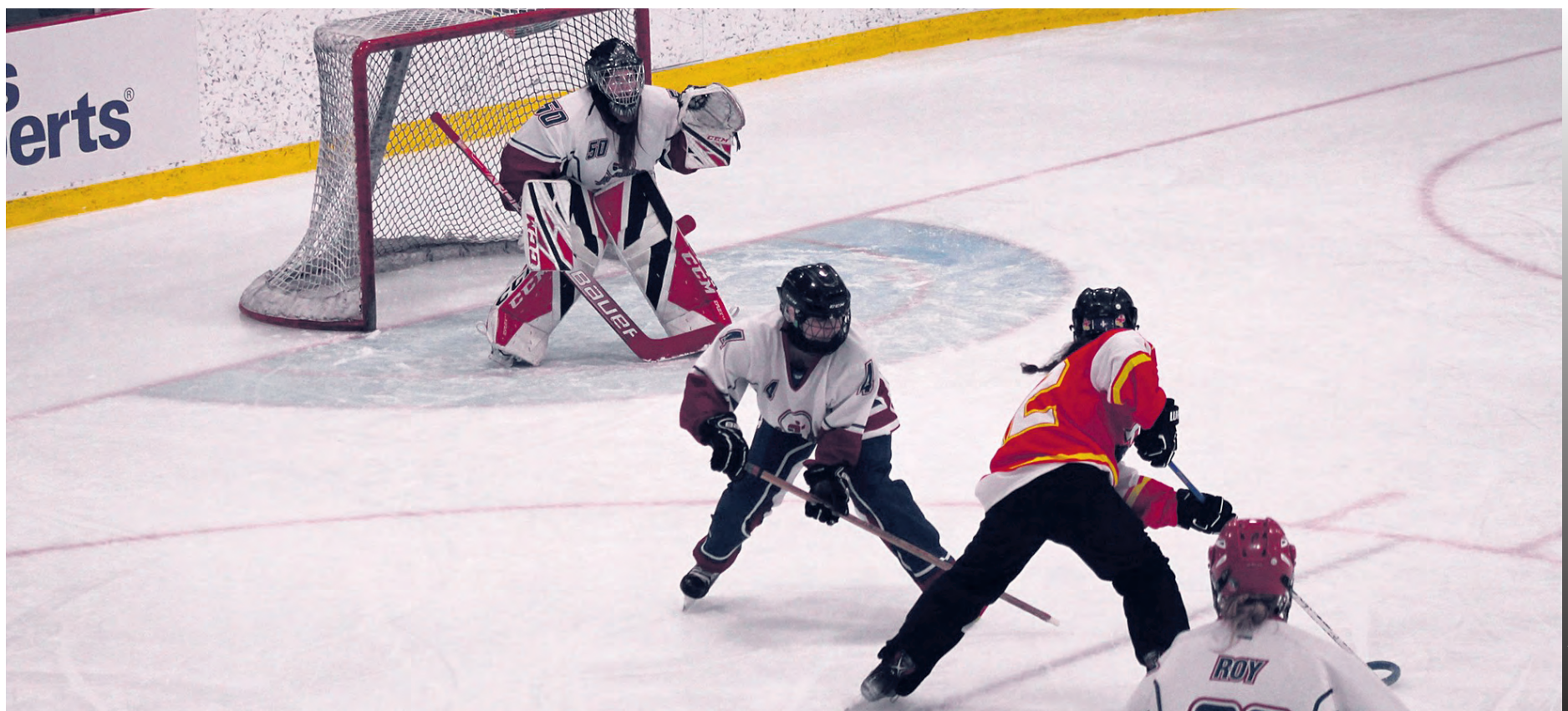
Sur la glace, les filles de l'équipe de Lanaudière ont tout donné.