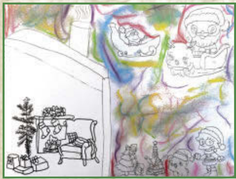
Naomie, 5 e année École Étienne-Chartier