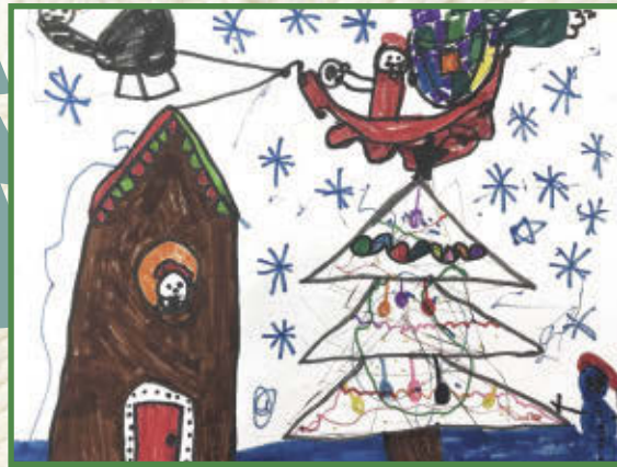
Rosalyn, 1 re année École de l'Épervière