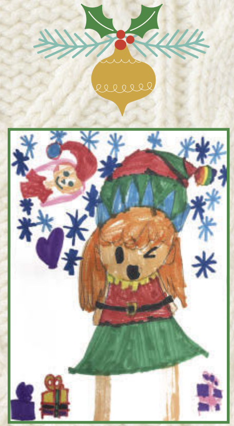
Meghan, 1 re année École de l'Épervière