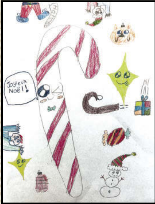
Raphaël, 2 e année École de la Chanterelle