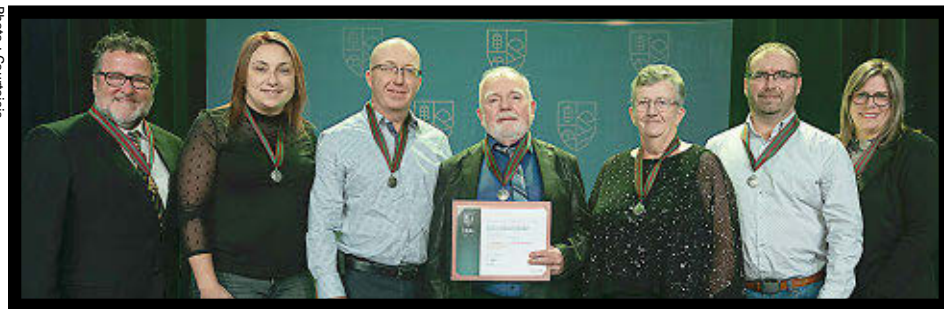
La Ferme Lorge a reçu l'Ordre du mérite agricole catégorie argent.

La ferme Lorge de Saint-Narcisse-de-Beaurivage a été récompensée lors de la cérémonie de remise des prix de l'Ordre du mérite agricole, tenue le 21 novembre dernier.