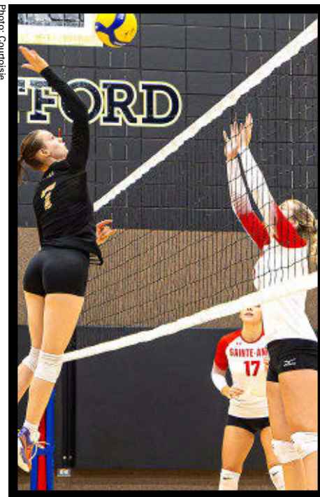
Les Filons accueilleront une équipe de division 3 à Saint-Agapit

Les mois à venir permettront à l'organisation de préparer la prochaine saison en tenant