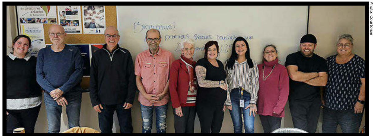
Les nouveaux Éclaireurs sont outillés pour offrir les premiers secours psychologiques.

Il s'agissait d'une réponse aux nombreux enjeux de santé mentale provoqués par les