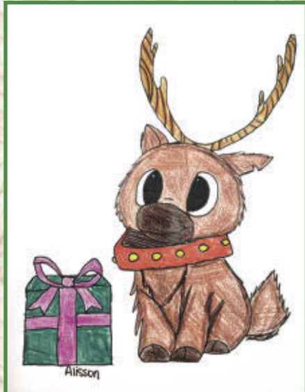
Alisson, 6 e année École des Quatre-Vents