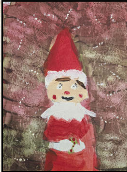
Camille, 4 e année École de l'Épervière