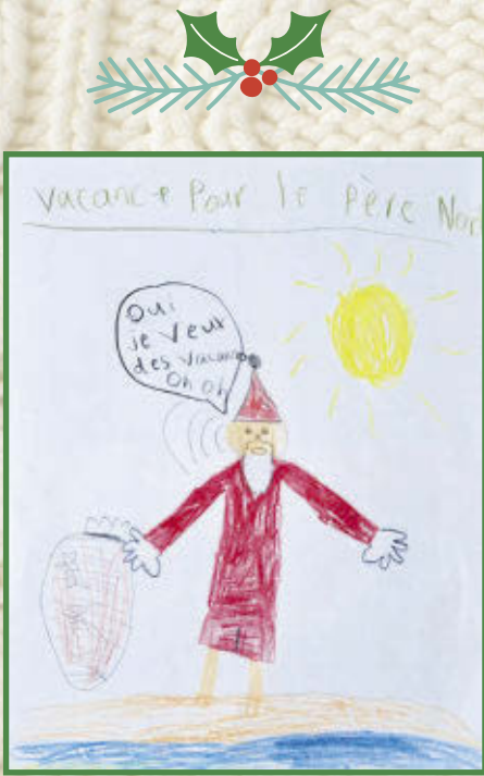
Abigaël, 3 e année École Etienne-Chartier