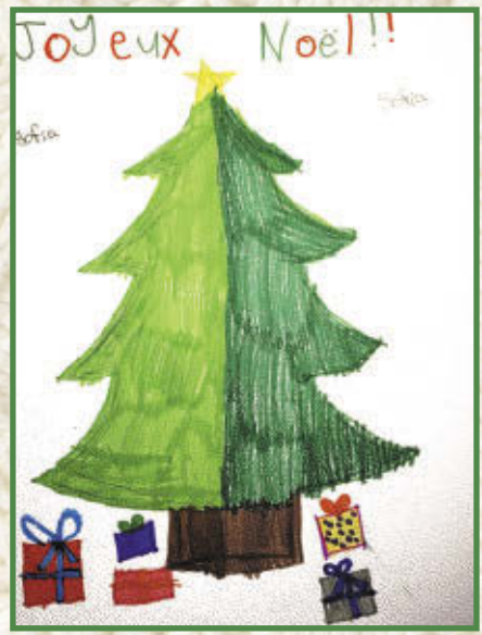
Sofia, 3 e année École de la Source