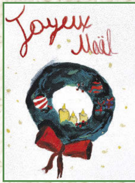
Alice, 5 e année École de la Source