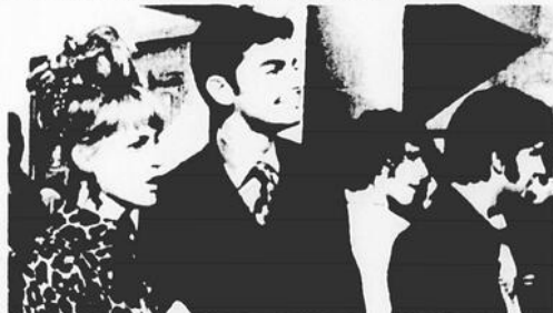
Le Journal intime d'une femme mariée

Le Journal intime d'une femme mariée apporte des éléments de réflexion sur les conditions de l'entente conjugale. Film où se mêlent la satire et l'étude psychologique, il se présente aussi comme un catalogue de tous les travers qui peuvent exaspérer une femme dans un mariage.