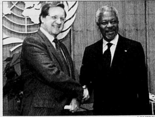
Le ministre Lloyd Axworthy effectuait hier une courte visite à New York où il a rencontré le secrétaire général de l'ONU, Kofi Annan, et le chef de l'UNSCOM, Richard Butler.

Après le départ précipité mercredi de Bagdad des membres de la Commission spéciale chargée du désarmement irakien (UNSCOM), l'ONU a évacué vers Amman une centaine de membres de son personnel humanitaire par mesure de sécurité. Un responsable jordanien a préci-