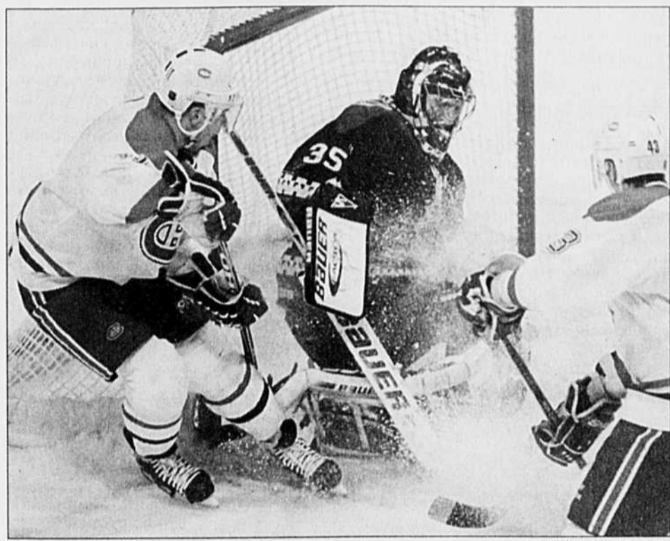
L'une des récentes illustrations des problèmes dans l'équipe montréalaise. Lundi, les Glorieux ont laissé filé une victoire en fin de match.