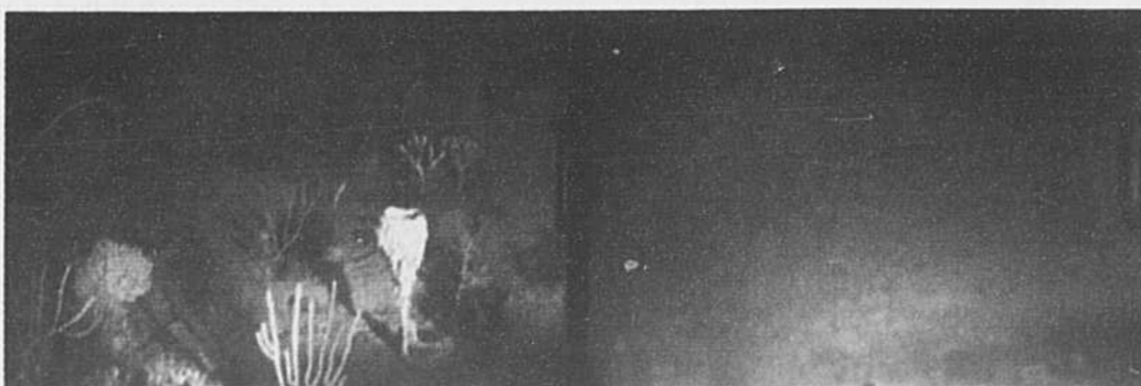
Un aperçu des ravages du raclage des fonds marins, «la plus importante menace qui affecte les mers du globe et qui peut expliquer, mieux que toute autre hypothèse, le déclin général des espèces maritimes», selon les chercheurs. Après le dragage, toute trace de vie disparaît (photo de droite).