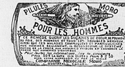
L'Etiquette est de papier blanc imprimé en bleu.

M. U. NEVEU, 604 rue St-Timothée, Montréal.