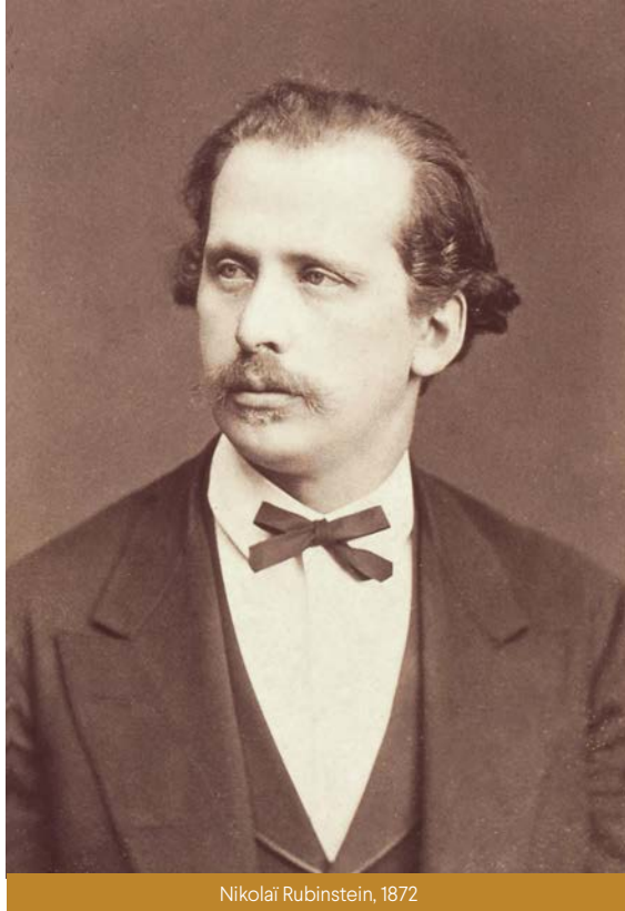
Nikolai Rubinstein, 1872