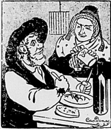
—Tu as encore faim ? —Mais oui, et c'est pas la fin.