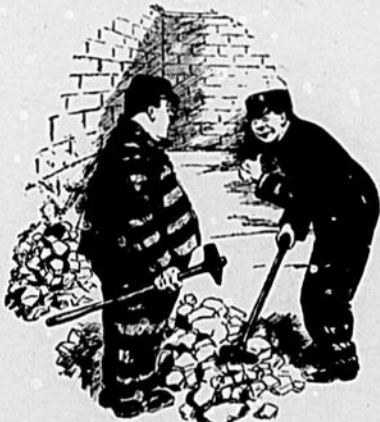
Si ces cailloux étaient des Allemands, au moins.

N'était-ce pas traiter ce jeune homme comme il le méritait?