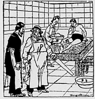
—Pas de blagues, je crois qu'on s'est trompé de jambe.