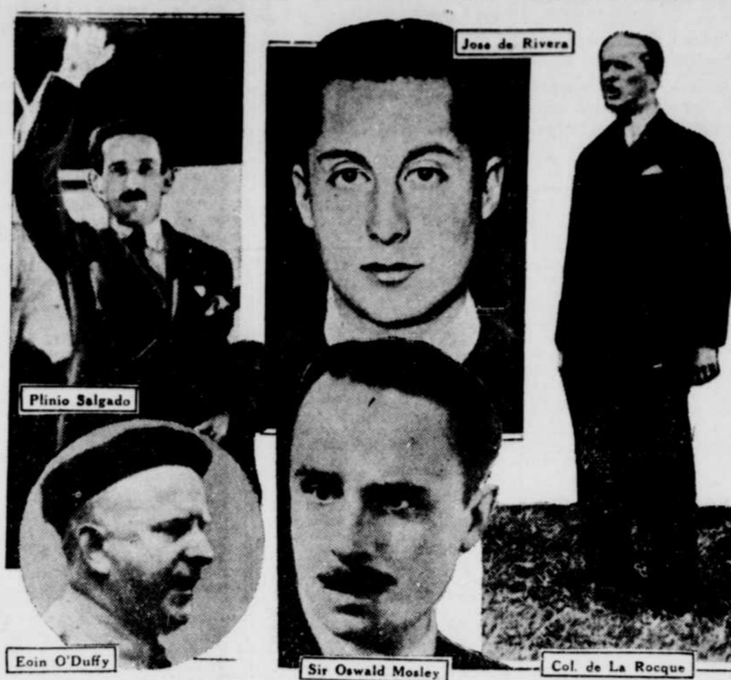
Tandis que Mussolini, de l'Italie, Staline, de la Russie, et Hitler, de l'Allemagne, sont au premier rang des dictateurs, cinq autres personnages se sont mis en vedette dans leurs pays. Ce groupe de chefs fascistes comprend le col. Casimir de la ROCQUE, chef des Croix de feu, en France; Sir Oswald MOSLEY, chef des chemises noires anglaises; Jose ANTONIO Primo de RIVERA, chef de l'ancien dictateur espagnol et chef du mouvement fasciste espagnol; le général Eoin O'DUFFY, organisateur des chemises bleues d'Irlande et Plinio SALGADO, qui tient la destinée des chemises vertes du Brésil entre ses mains.