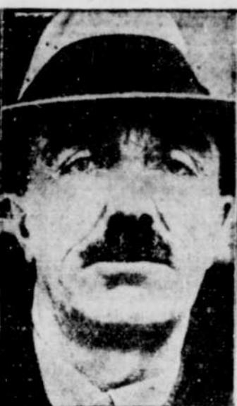
L'HON. WALTER LEA, premier ministre libéral de l'Île du Prince Édouard, décédé ce matin à Charlottetown.

L'hon. Walter M. Lea a succombé à une pneumonie double à Charlottetown, ce matin. — Chef du parti libéral, il avait établi un précédent dans l'histoire parlementaire de l'Empire en remportant tous les sièges à la Législature, aux élections de juillet 1935.