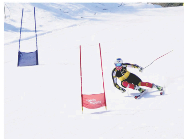
Le Mont-Édouard a la seule piste au Québec possédant l'homologation FIS de la catégorie Super G. Sur la photo Critérium U16, février 2018.

Cet hiver, les amateurs de sports de glisse ont rendez-vous au Mont-Édouard. Plus dynamique que jamais, la station de ski proposera plusieurs activités durant la saison 2018-2019. Surveillez sa page Facebook pour ne rien manquer de sa programmation!