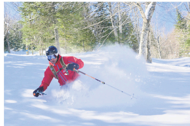
Véritable paradis de la poudreuse, le Mont-Édouard reçoit en moyenne 6 mètres de neige par hiver.