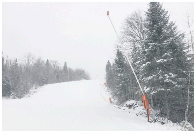
Le Mont-Édouard est équipé de la plus haute technologie d'enneigement automatisée au Québec.

L'an passé, la station anjeannoise a été l'hôte du Critérium U16, soit l'événement le plus important dans le domaine du ski alpin, après les Jeux du Québec. Cette année, elle recevra l'élite canadienne du ski alpin, à l'occasion des Championnats canadiens 2019 des calibres U18, U21 et seniors; la plus importante