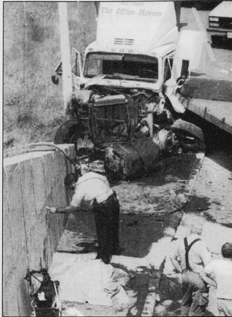
Un policier d'Ottawa marque un mur près du cadavre d'une femme tuée par un camion-remorque qui a raté une sortie, avant de s'écraser six mètres plus bas, sur une voie de transit.

«J'ai vu de la grosse fumée blanche et j'ai été un des premiers à arri-