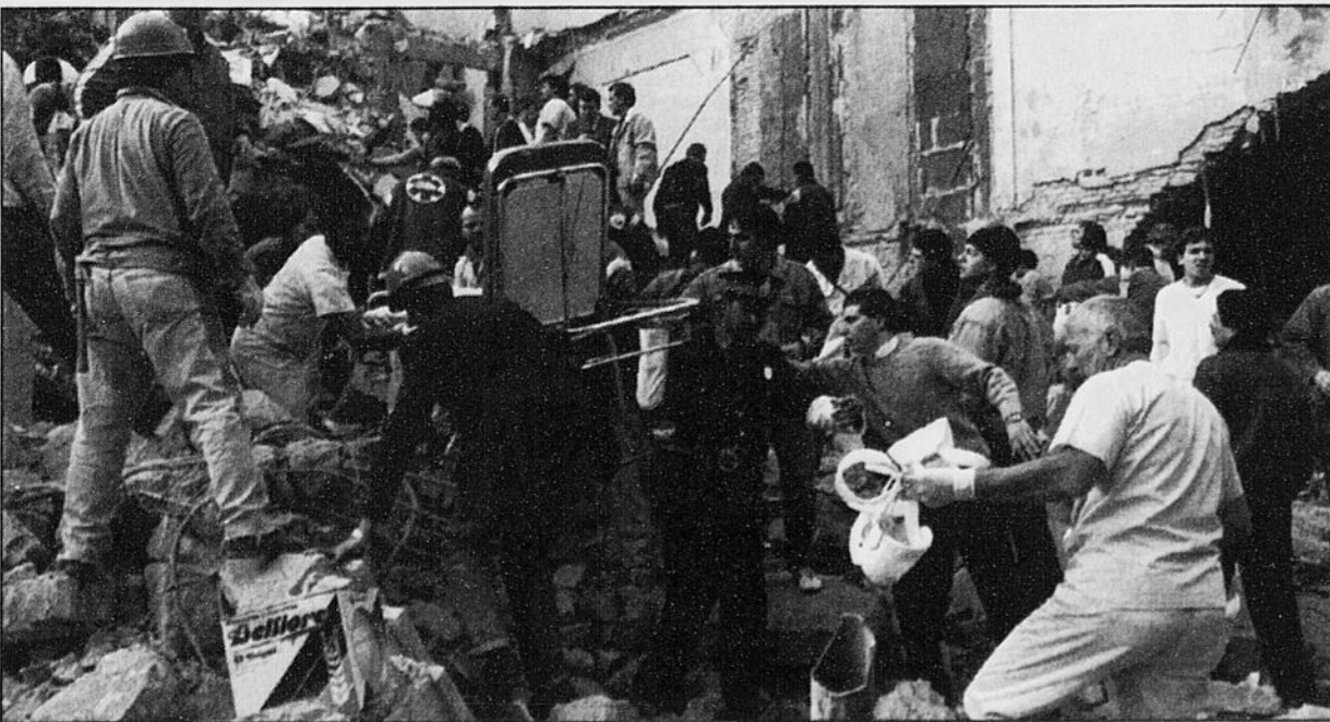
Des secouristes tentent de se frayer un chemin à travers les débris de l'immeuble qui s'est effondré à la suite de l'explosion qui s'est produite hier matin, à 10h, près d'un immeuble qui regroupait deux organisations juives. On soupçonne un groupe étranger d'être à l'origine de cette déflagration.

Le Président Carlos Menem a déclaré que les services de renseignement et de sécurité israéliens avaient offert leur coopération aux autorités argentines pour déterminer les responsabilités.