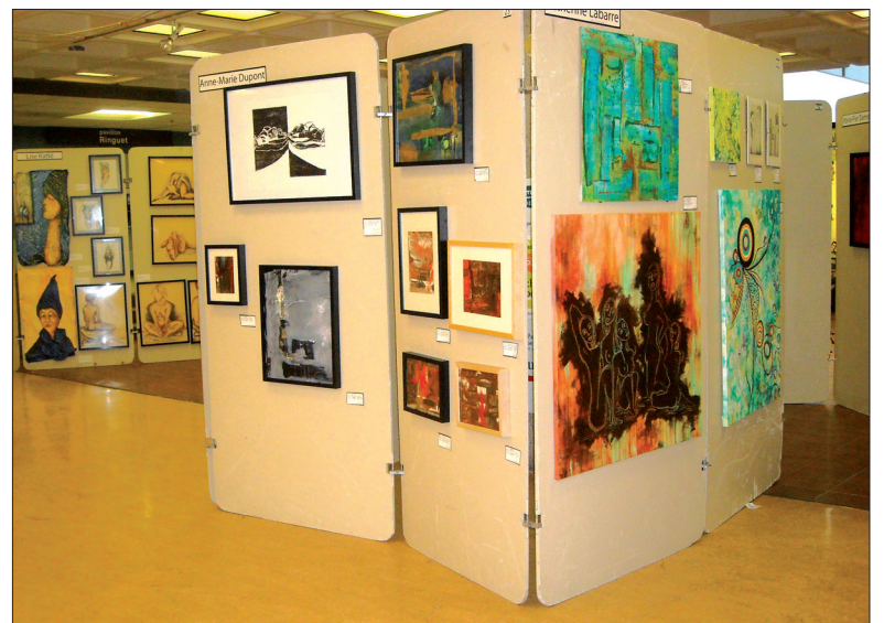
Plus de 80 œuvres ont été exposées dans l'entrée principale du pavillon Albert-Tessier de l'UQTR lors de l'Expo-Vente Biannuelle des étudiants en Arts.

Cette année, un concours était organisé afin d'augmenter les profits de l'Expo. Au coût minime de 2$, les gens pouvaient se procurer un billet leur permettant de gagner une œuvre d'art signée par la responsable de l'événement, Mme Bonraisin. Une fois de plus, l'UQTR a prouvé qu'elle regorge de talents et a permis à la population étudiante d'en profiter.