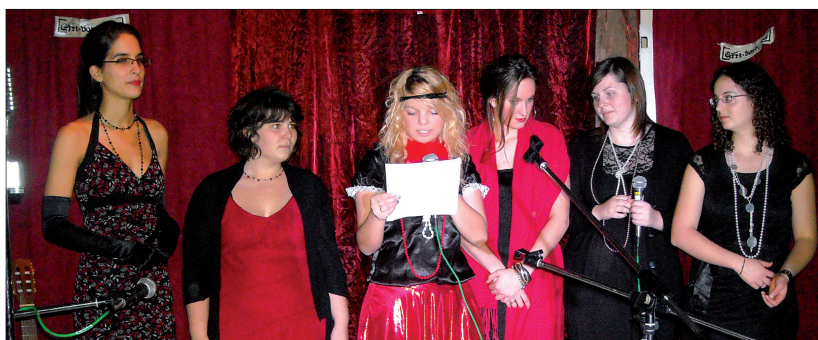
Une partie du comité organisateur de la 4 e édition d'Art-BorèSens affichait pour l'occasion un style vestimentaire des années vingt.

Plusieurs personnes ont participé à cette annuelle soirée d'Art-BorèSens et comptent bien récidiver lors d'une cinquième édition l'an prochain.