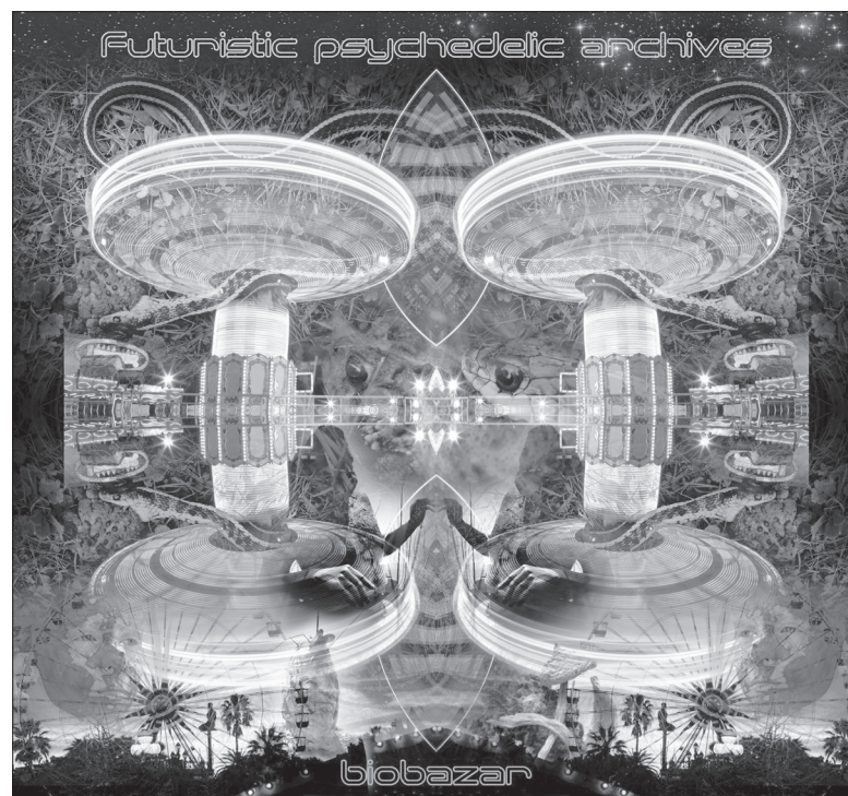
L'album Futuristic psychedelic archives de Biobazar propose un condensé de musique électronique aux échantillonnages surprenants.

Pour écouter la musique de Dany Janvier, consultez le : myspace.com/biobazar