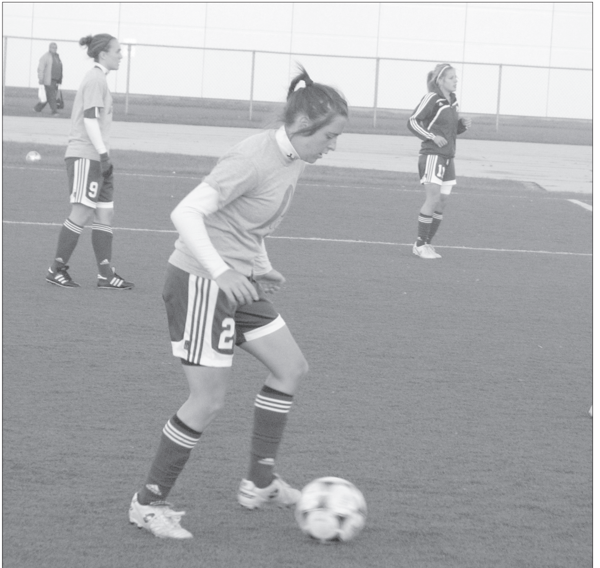
Au niveau collectif, j'ai été épaté par la ténacité des joueuses de l'équipe féminine de soccer, qui n'ont jamais baissé les bras malgré les obstacles.

Avant de ranger mon stylo et mon calepin, je tiens à féliciter l'équipe féminine de soccer des