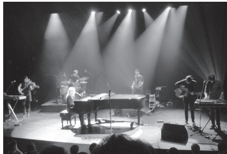
Armée de son humour pince-sans-rire et de son sourire taquin, la jeune fille n'a pas tardé à conquérir le cœur du public.

nommé dans la catégorie album francophone de l'année au Prix Juno 2009 et son morceau Comme des enfants a atteint la première place du palmarès des albums vendus au Canada en février dernier.