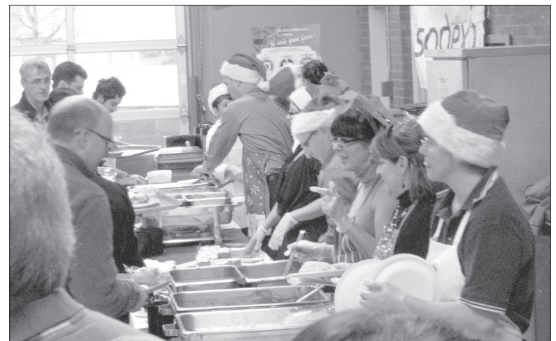
Des membres du personnel de Sodhexo ainsi que du comité organisateur ont uni leurs efforts pour servir le repas.