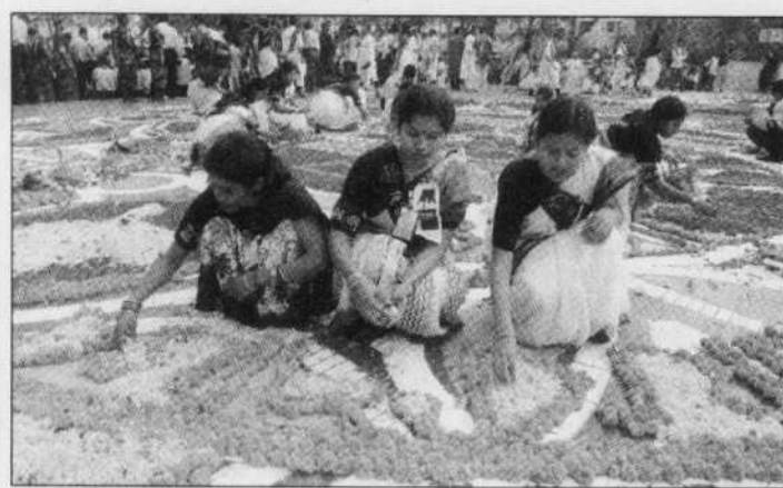
Des étudiants de l'université de Dhaka, au Bangladesh, ont souligné hier la Journée internationale de la langue maternelle en érigeant un autel de fleurs.

Il faut dire qu'il y a encore beaucoup de travail à abattre de ce côté, plus de 90 % des langues n'étant pas représentées sur le Net. Et quand elles le sont, ce n'est guère représentatif du partage des langues dans le monde. En effet, les sites offrent du contenu en anglais dans une proportion de 72 %. Suit ensuite l'allemand, avec 7 %, puis le français, le japonais et l'espagnol avec seulement 3 %.