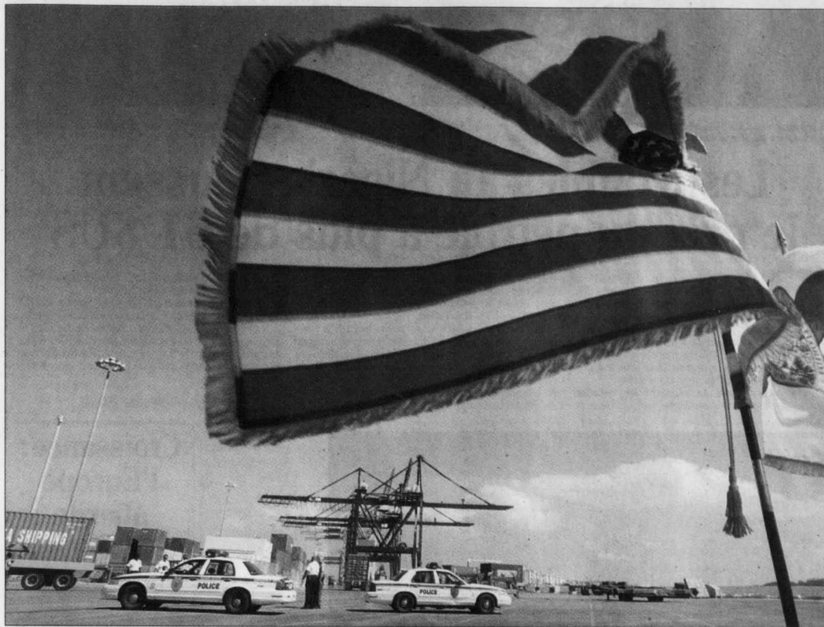
Des policiers montent la garde devant le port de Miami pendant une conférence de presse au cours de laquelle le maire de la ville faisait part de ses inquiétudes au sujet de la vente des installations portuaires à un groupe des Emirats arabes unis. Face aux nombreuses protestations à ce sujet, le président Bush a toutefois promis d'opposer son veto à toute loi destinée à geler cette vente controversée.