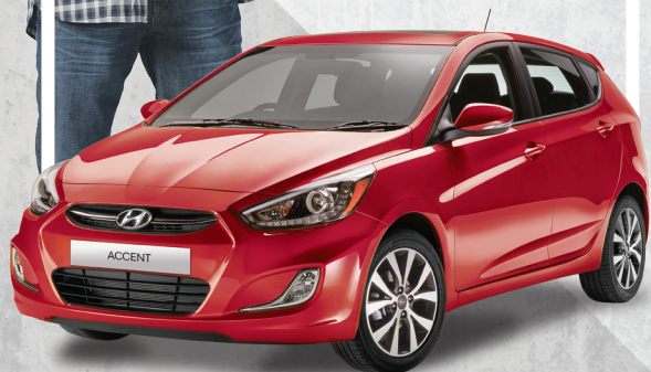
Modèle GLS auto montré*