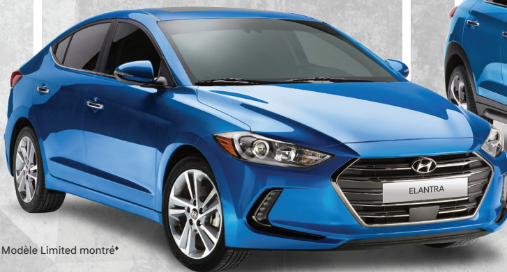
Modèle Limited montré*