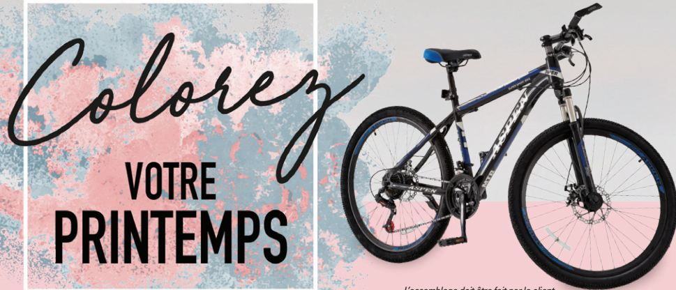
L'assemblage doit être fait par le client.