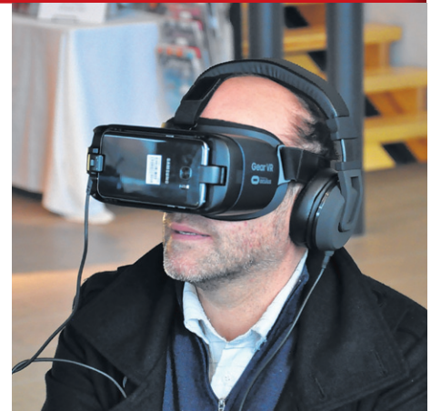
Le film en réalité virtuelle a été lancé en mai 2017.

« Nous sommes très heureux de recevoir une telle reconnaissance de nos pairs à l'échelle canadienne. Nous sommes particulièrement fiers, car ce prix souligne l'aspect novateur d'un projet mettant en valeur l'histoire de la Gaspésie et de