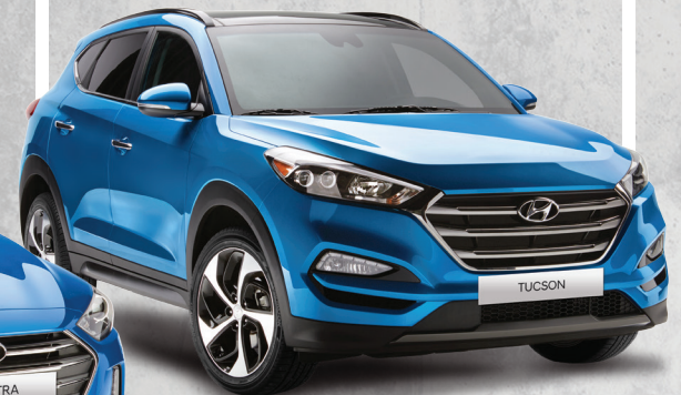
Modèle Limited montré*