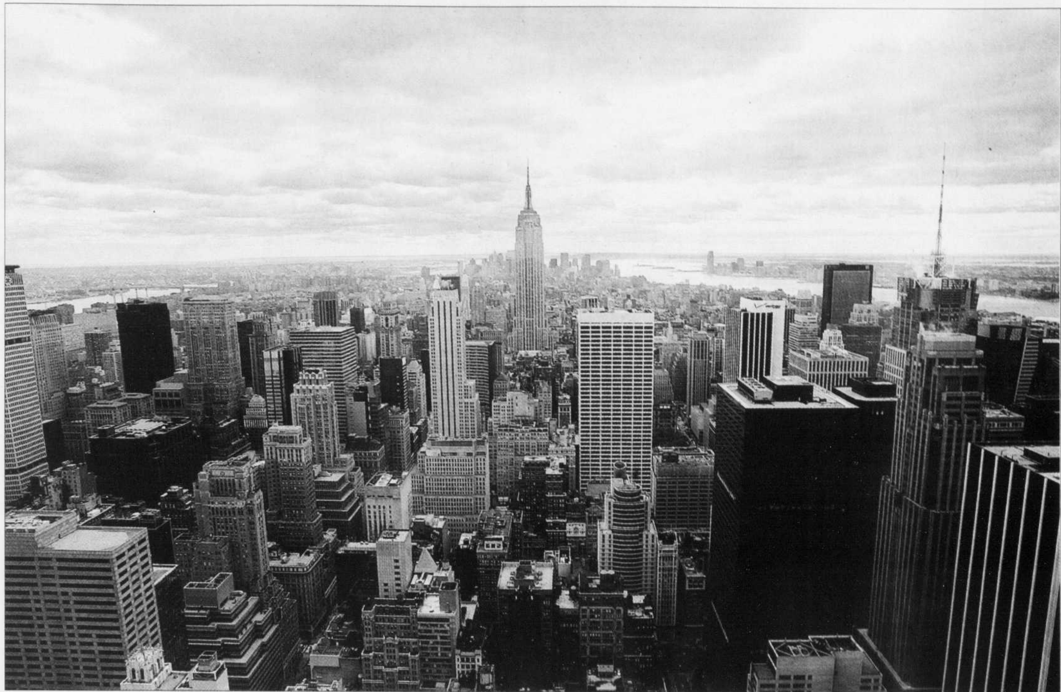
Une image vaut mille mots pour exprimer le saisissement, la netteté de la découpe des gratte-ciel dans un ciel aux traînées mauves, les puits de lumière des avenues, des rues, à l'infini et ces mille yeux qui scintillent, qui s'illuminent progressivement.

Le visage des États-Unis, que l'ensemble du monde appelle l'Amérique, a été fortement mis à mal depuis les célèbres attentats d'il y aura bientôt cinq ans. Mais parce qu'un pays ne se réduit pas à son gouvernement, des intellectuels ont eu envie de témoigner de leur vision de cette Amérique réelle, rêvée, mythique. Le Devoir offrira tous les lundis de l'été de larges extraits de ces regards croisés.