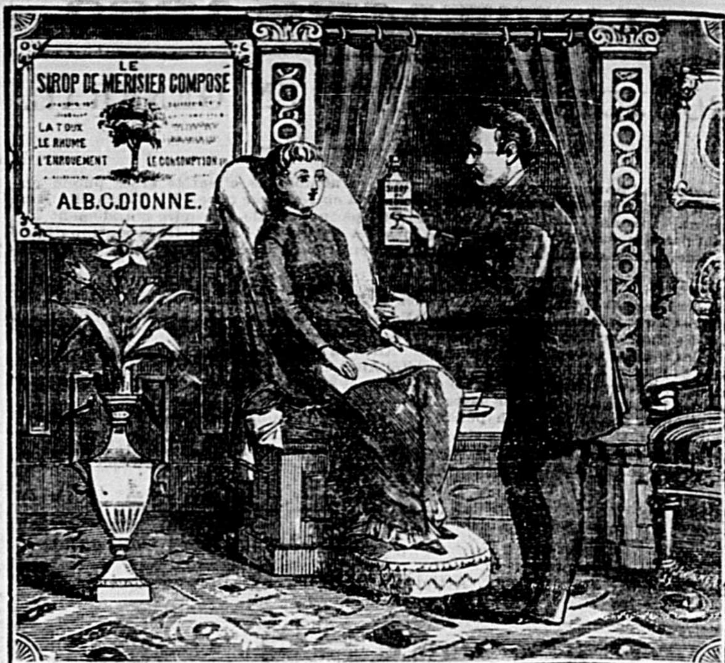
Voici Madame le vrai Sirop de Mérisier Composé de ALB. C. DIONNE c'est le seule remède qui peut vous guérir de ce rhume et de cette toux mortel.

On ne peut retenir des chambres si on d'avance. Pour plus amples détails s'adresser à ALLANS, RAE & CIE, Agents Québec.