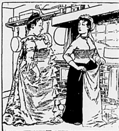
— Augmenter vos gages? Mais vous savez à peine faire la cuisine et tenir une maison. — C'est justement pour ça, madame. Comme je n'ai pas encore l'habitude, je me donne beaucoup plus de mal qu'une autre!