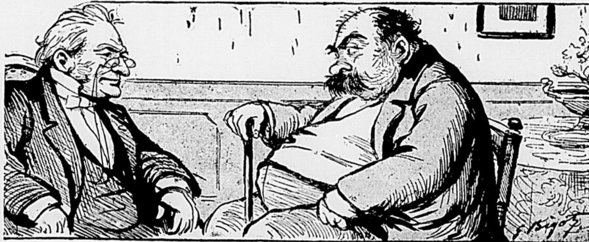
— Docteur, je ne me sens pas bien... j'ai toujours des gaz. — Le Docteur, distrait. — Eh bien, faites-vous poser l'électricité!