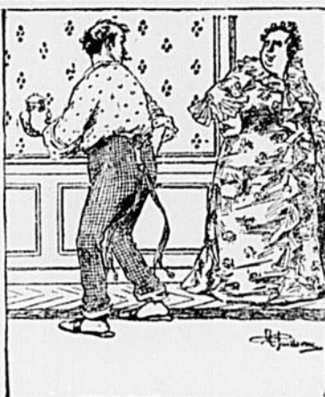
— Après avoir pris la dot de ma fille sans apporter un sou dans la maison, ça a l'air de d'mander d'eau chaude tous les matins pour sa barbe!