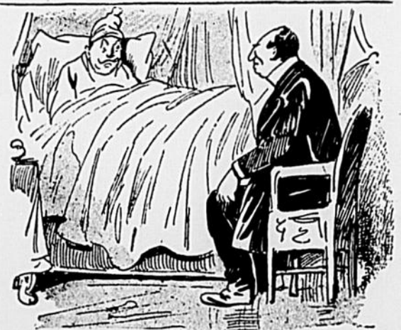
— Ne me parlez pas des médecins ! Il y a trois semaines, un automobile m'a écrasé les deux jambes ; eh bien, mon docteur persiste à me soigner pour de la grippe!