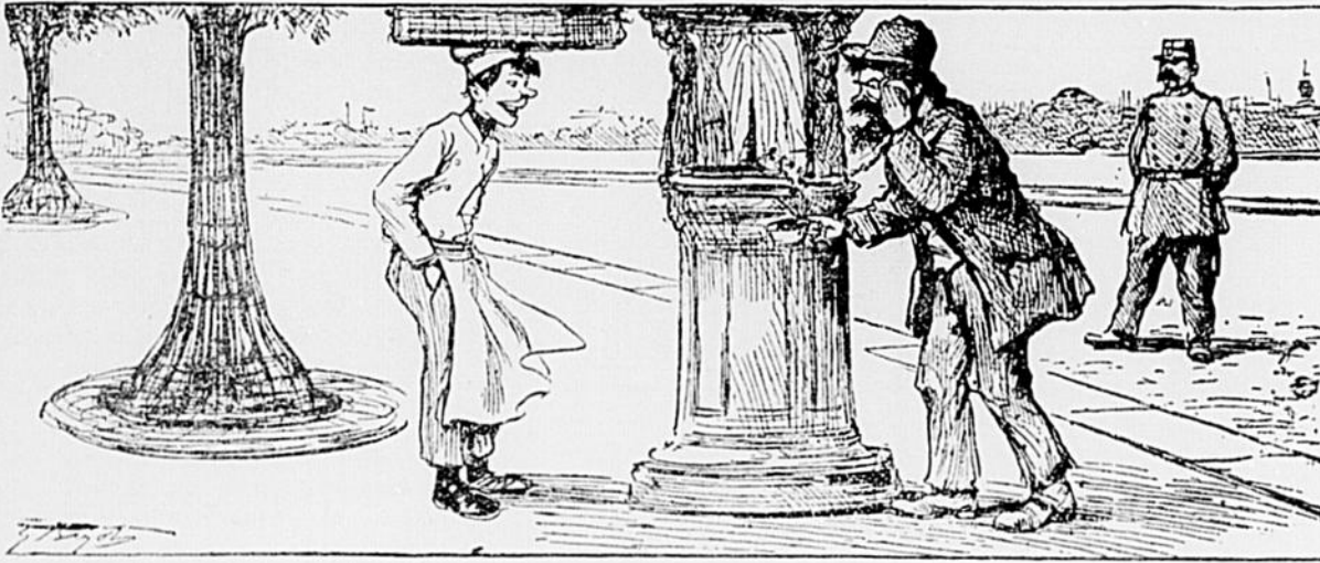
A la Wallace — Le téléphone du pochard — Allô! Allô! mon palais est en feu!