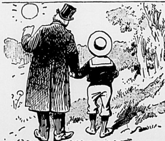
— Pourquoi qu'il a des taches le soleil ? — Parce qu'il a fait comme toi ; il n'a pas mis sa serviette pour manger sa soupe!

Dictée pour le jour de l'ouverture de la pêche. L'instituteur, distrait (il a taquiné le goujon toute la matinée), commence en ces termes : "La folie du pêcheur (à la ligne).