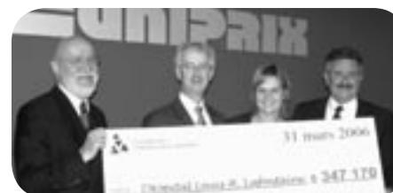
Cette année la Fondation a remis un don de 347 170 $