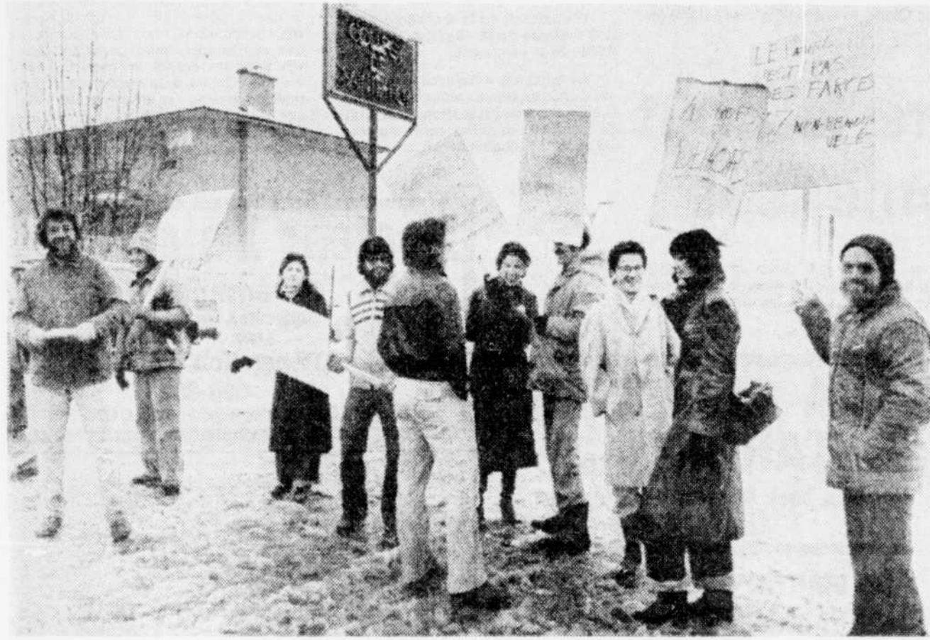
Le Soleil, Clément Thibault

La ville de Charlesbourg a eu son hold-up, hier soir. Le poste d'essence situé au croisement de la 80e Rue et de la 10e Avenue, a été soulagé de $200 par un individu portant des verres fumés et armé d'un revolver. Le voleur s'est enfui à pied vers la rue Chamoin. Les policiers ont suivi ses traces dans la neige, mais ils n'ont pu le repérer.