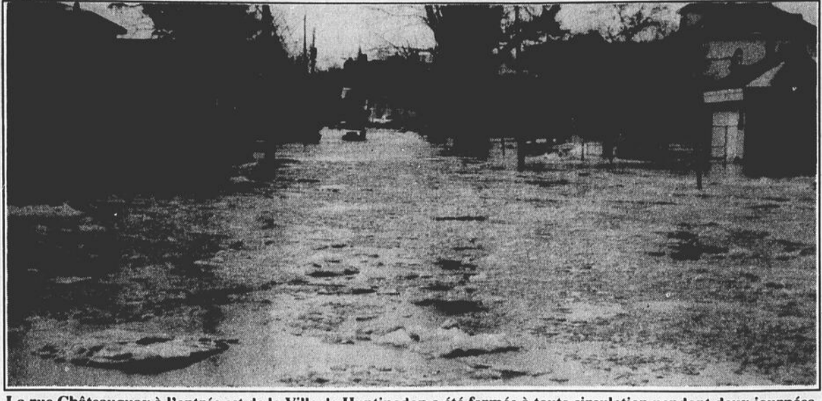
La rue Châteauguay à l'entrée est de la Ville de Huntingdon a été fermée à toute circulation pendant deux journées, à cause de l'eau et la glace.