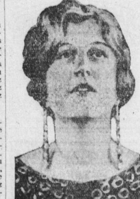
Madame SIGRID ONEGIN, contralto de renommée mondiale, qui donnera un récital au théâtre Saint-Denis ce soir, à 8 h 30.