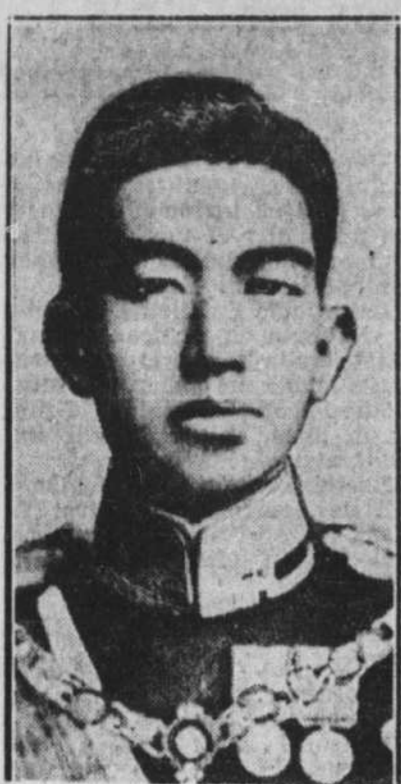
L'Empereur du Japon, HIROHITO, a échappé à un attentat, vendredi dernier.

100 La Compagnie s'engage à garantir la Cité contre toutes récla-