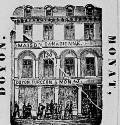
Pavillon Tricolore, MAISON CANADIENNE, No. 136, Rue Notre-Dame.

Le Soussigné prend la liberté d'informer ses nombreuses pratiques et le public en général, qu'il a reçu et reçoit encore un assortiment des plus complets pour Hâves de Printemps et d'été.