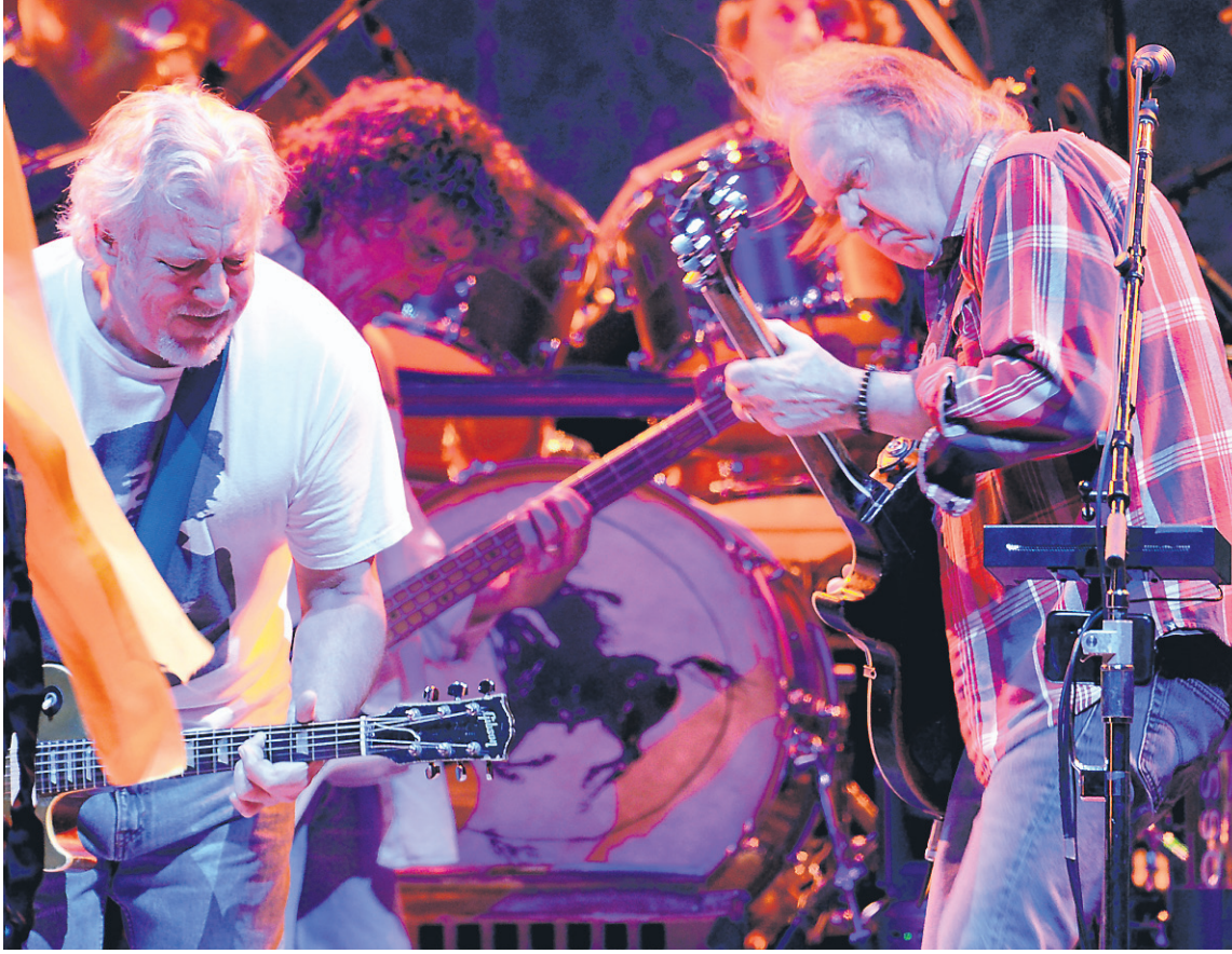
Neil Young était bien en selle sur son fougueux Crazy Horse vendredi soir au Centre Bell.

D'entrée de jeu, notre adolescent attardé avait prévu une petite mise en scène digne d'un sketch d'école secondaire: au son des Beatles, des mecs en sarrau aménageaient les décors, on pouvait contempler quatre gigantesques amplis de marque Fender sur lesquels on projeterait ensuite des formes lumineuses. Un immense drapeau canadien a été déployé, hymne national à l'appui, ce qui n'a pas tout à fait déclenché cette ferveur qu'on imagine dans les autres escales du vieux routier dans son pays d'origine.