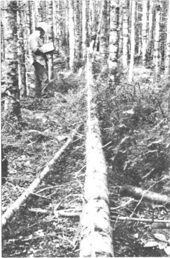
Figure 1: Mesure de la longueur totale et de la hauteur de cime d'un arbre abattu