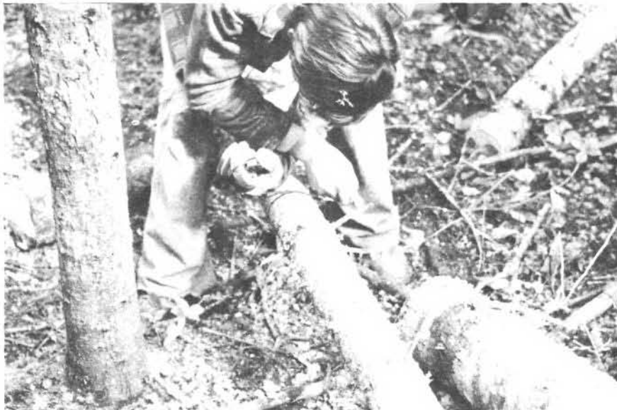
Figure 2: Tous les diamètres sont mesurés à l'aide d'un galon circonférenciel