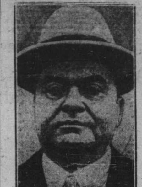
JOHN RINGLING. — Le roi du cirque, qui vaut $100,000,000, déclare qu'il ne peut rencontrer ses échéances.

L'Amicale Saint-Stanislas donnera ce soir, le 21 novembre, à la salle de l'école Saint-Stanislas, un banquet aux huîtres. Tous ses membres et tous ceux qui sont passés par cette maison sont invités. Le banquet aura lieu à 8 h. 30. Il y aura aussi des rafraichissements appropriés à la circonstance.