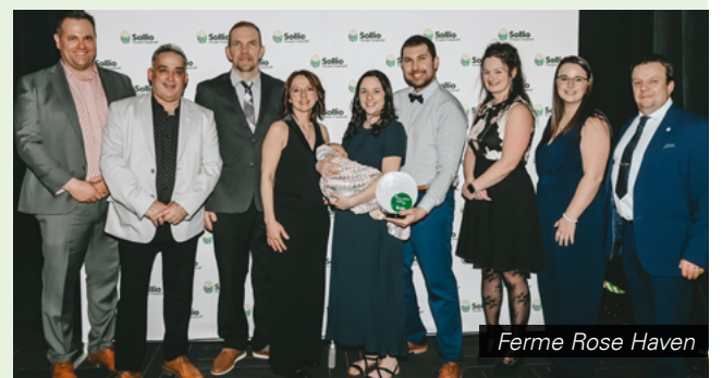
Ferme Rose Haven

Outre la modernisation des infrastructures, la ferme mise sur une gestion financière rigoureuse, notamment grâce à son implication dans la Coopérative d'utilisation de matériel agricole (CUMA) du Témiscamingue, qui lui permet de partager des équipements d'une valeur de 400 000 $. Cet esprit