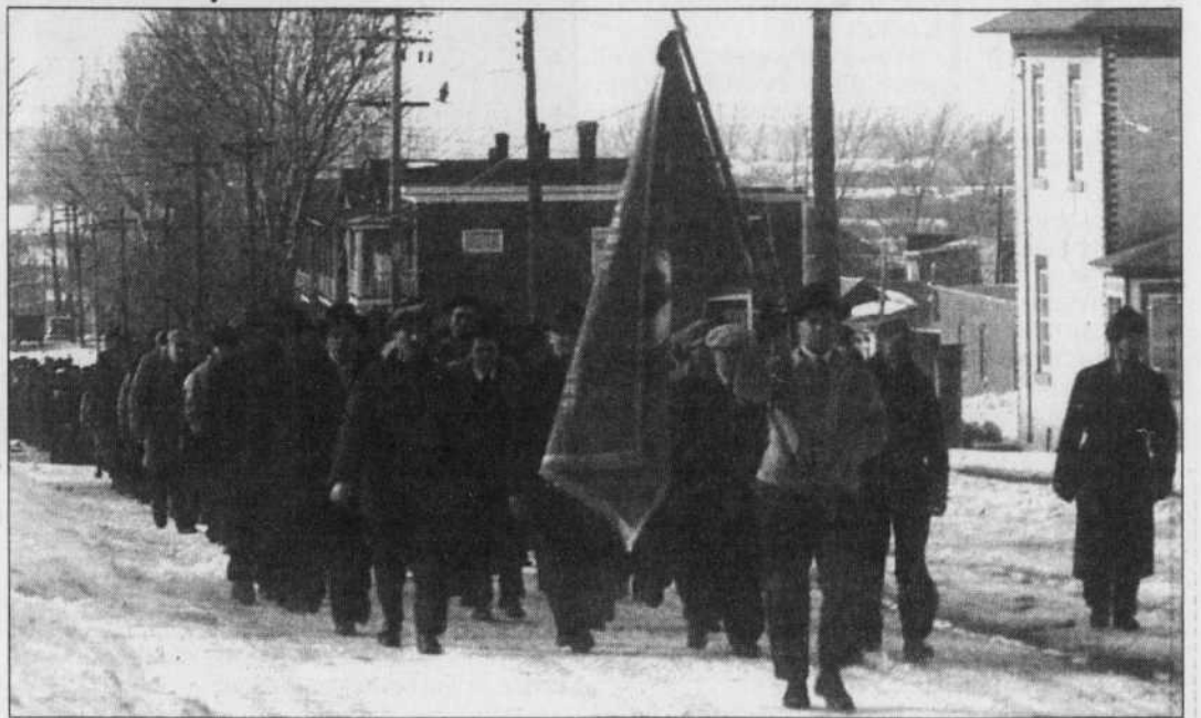
LE FRONT OUVRIER, MOUVEMENT DES TRAVAILLEURS CHRÉTIENS

M. Picard ajoute que les divers syndicats se sont entendus, dans