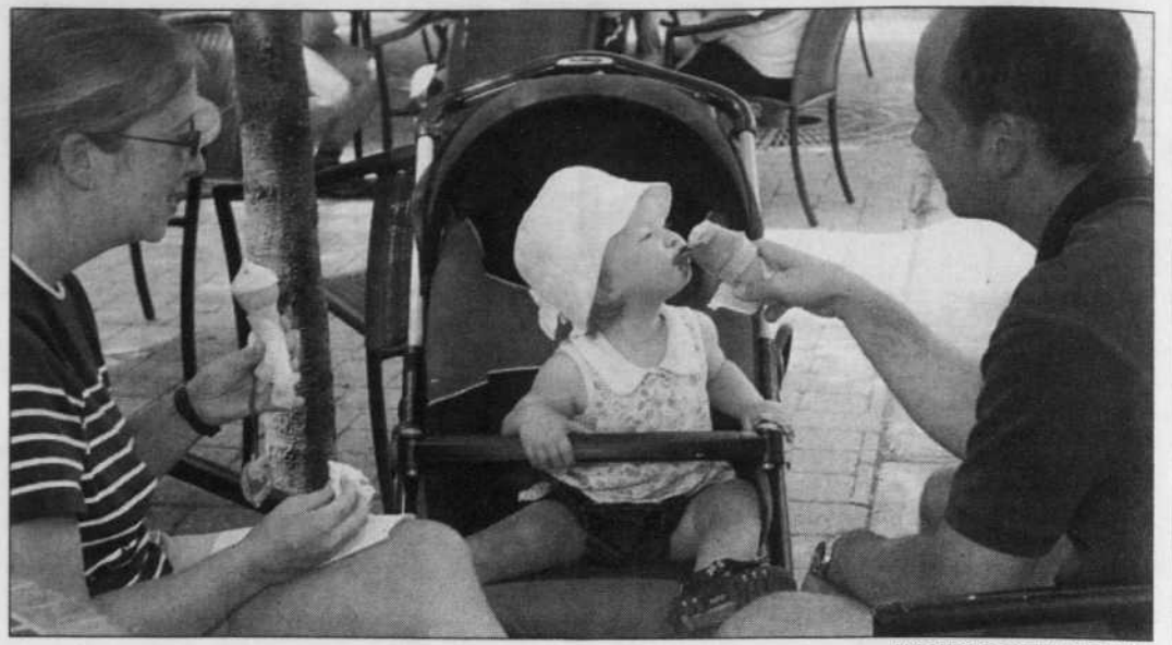
JACQUES GRENIER LE DEVOIR

On ne comprend pas non plus, à Québec, pourquoi Ottawa peut s'entendre à un tel prix avec les provinces atlantiques mais ne peut accepter de verser 275 millions de plus pour conclure l'accord promis sur les congés parentaux.