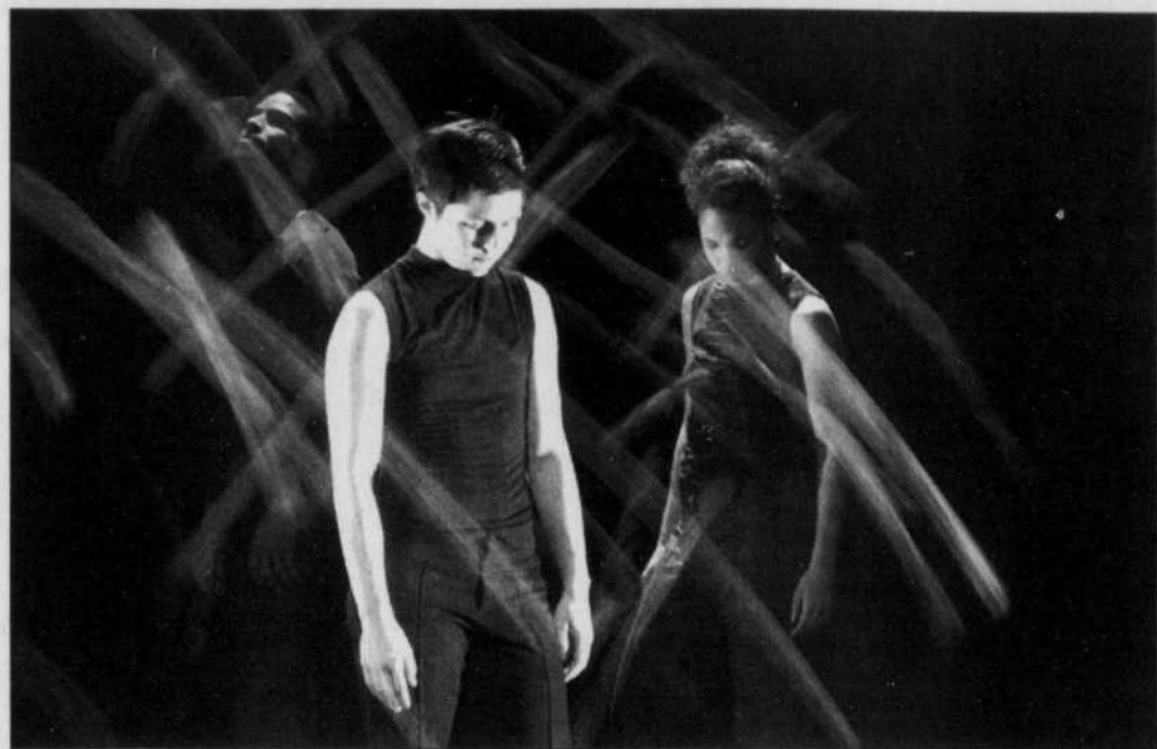
Danse Passare , une œuvre de Ginette Laurin présentée par O Vertigo, compagnie qui inaugurera bientôt de nouveaux locaux à la Place des Arts.

Ne réalisez-vous pas que toutes ces annonces faites par l'ancien gouvernement péquiste m'enlèvent aujourd'hui toute marge de manœuvre, puisque le poids du service de la dette du ministère de la Culture et des Communications correspond à 25 % du budget du ministère? Je suis inquiet de constater que 25 % du budget de la culture est versé en intérêts sur l'hypothèque, et ce, sans compter le projet du Quat'Sous.