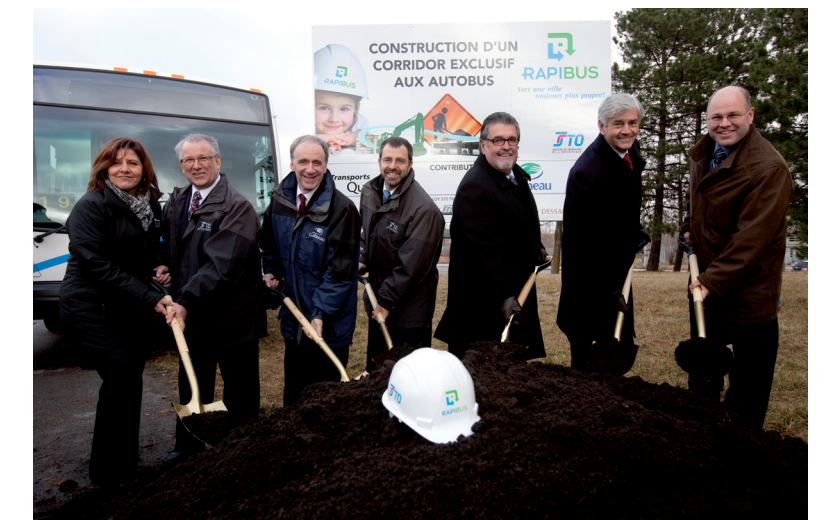
Début des travaux de construction du Rapibus (2009)

Publication du premier Guide de l'usager qui regroupe les horaires et parcours des lignes du réseau (1995).