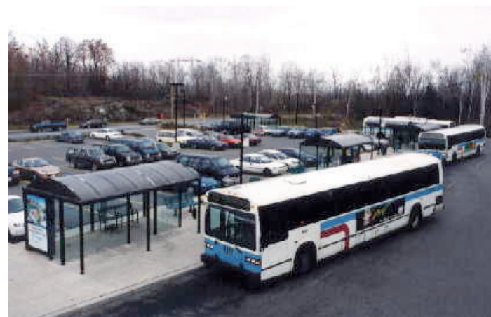
Inauguration du premier stationnement incitatif au Québec, le Parc-o-bus Jean-René-Monette (1994).

Lancement du Plani-Bus. Il s'agit du premier outil du genre au Canada puisqu'il permet à un usager d'obtenir sur le Web un itinéraire personnalisé de déplacement en intégrant les données des deux sociétés de transport en commun voisines, soit la STO et OC Transpo (2010).