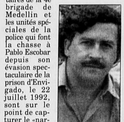
Pablo Escobar, le «narc» le plus célèbre de Colombie

BOGOTA — «Nous sommes pratiquement sur ses talons...» A en croire le général Bermudez, les militaires de la 4e brigade de Medellín et les unités spéciales de la police qui font la chasse à Pablo Escobar depuis son évacuation spectaculaire de la prison d'Envigado, le 22 juillet 1992, sont sur le point de capturer le «narc» le plus célèbre de Colombie.