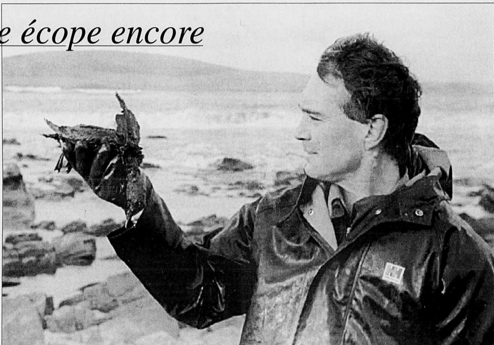
Un travailleur volontaire tient dans ses mains un oiseau de mer tout couvert du pétrole que laisse échapper le Braer, échoué aux îles Shetland. Cette région est l'un des plus riches sanctuaires d'oiseaux de la planète. La vie de 10 000 oiseaux est menacée. Six avions ont répandu hier du détergent afin de disperser la nappe de pétrole qui ne cesse de s'étendre.