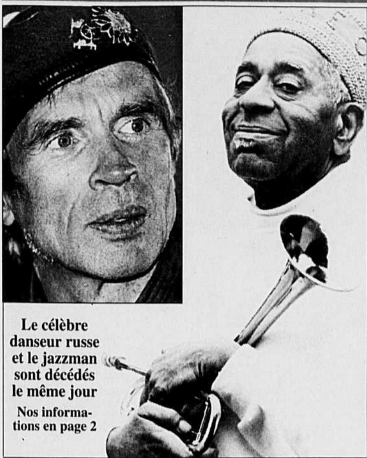
Le célèbre danseur russe et le jazzman sont décédés le même jour. Nos informations en page 2