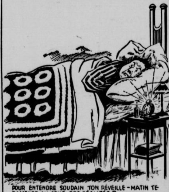
POUR ENTENDRE SOUDAIN TON RÉVEILLE-MATIN TE RAMENER AU SENS DES RÉALITÉS ?