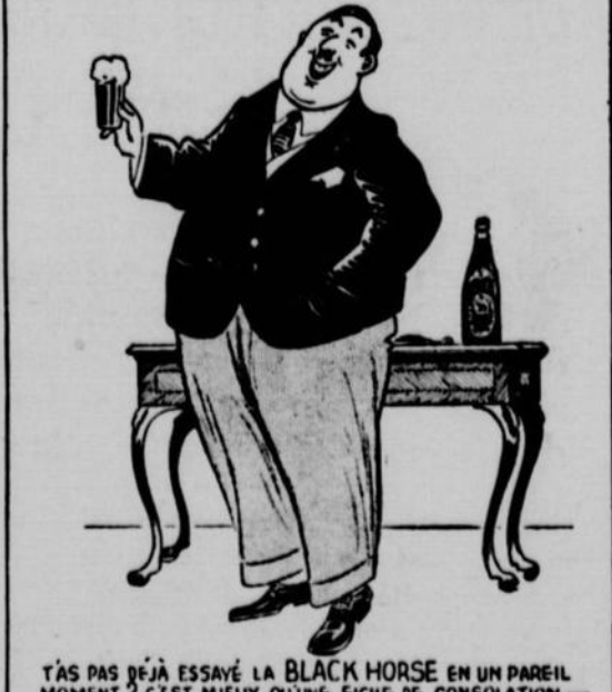
T'AS PAS DÉJÀ ESSAYÉ LA BLACK HORSE EN UN PAREIL MOMENT ? C'EST MEILLEUR QU'UNE FICHE DE CONSOLATION.