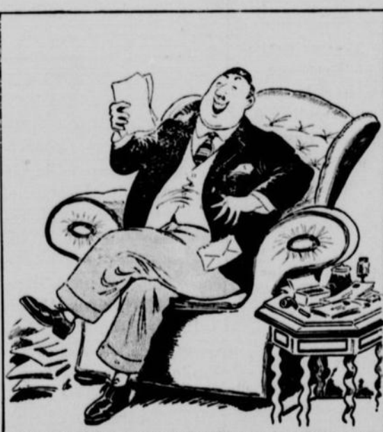
T'AS PAS DÉJÀ REÇU UNE LETTRE T'ANNONÇANT QU'UN ONCLE TE LAISSAIT UN HÉRITAGE D'UN DEMI-MILLION ?