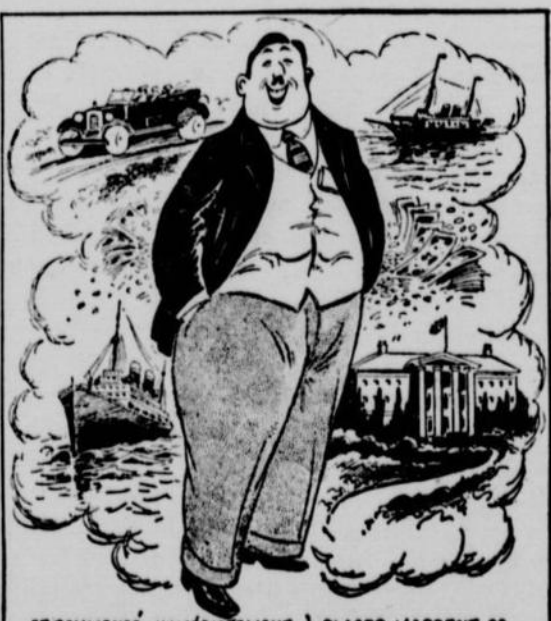
ET COMMENCÉ IMMÉDIATEMENT À PLACER L'ARGENT DE TON PARENT—AUTO DE LUXE, YACHT PRIVÉ, CLUBS, CROISIÈRE MONDIALE ET RÉSIDENCE PRINCIÈRE ?