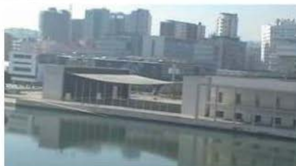
Vue en téléphérique du Casino de Lisbonne.

Pendant mes 10 jours passés à Lisbonne, des gens ont fait des dizaines et des dizaines de kilomètres avec moi pour s'assurer que j'aie le privilège de visiter les villes de Sintra, Cascais, Estoril et même Faro !!! Quand on sait que le litre d'essence coûte deux fois plus cher qu'ici, j'ai simplement été estomaqué de voir que pour un petit joueur comme moi, on prenne la peine de s'assurer de mon bien-être de cette façon. À TOUS les jours, il y avait quelqu'un avec moi qui me faisait visiter cette superbe ville qu'est Lisbonne.