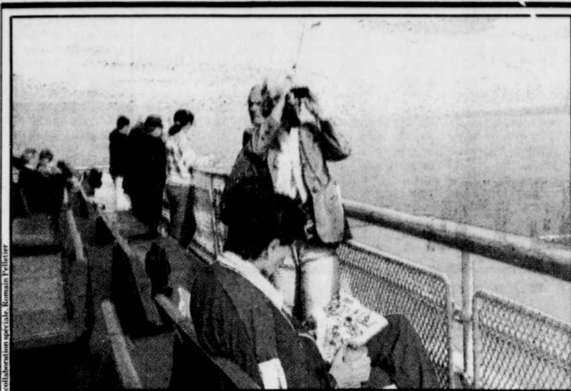
Des passagers prennent l'air sur le pont des embarcations du Camille Marcoux.

Le tourisme français à Pohénégamook Santé Plein Air se porte bien. Cet été, 400 Français ont séjourné à la base de plein air de Pohénégamook et 300 autres sont attendus lors de l'hiver 1994, résultat de trois ans d'efforts de mise en marché au plan international. En 1994, les organisateurs seront à Paris et Bruxelles dans le cadre d'importants salons à caractère touristique.