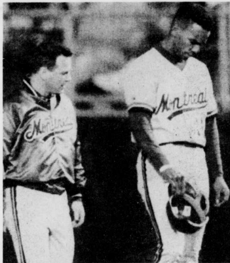
Accompagné du soigneur Ron McClain, Moises Alou a dû quitter le match en troisième manche, lundi, après avoir subi une elongation à l'aîne en courant vers le premier but.

Il s'agissait pour les Braves d'une troisième victoire consécutive, d'une 17e à leurs 20 derniers matchs.