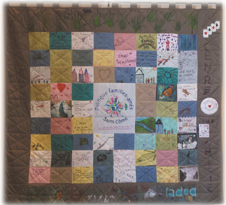
Courtepointe intergénérationnelle dévoilée le 29 août 2015