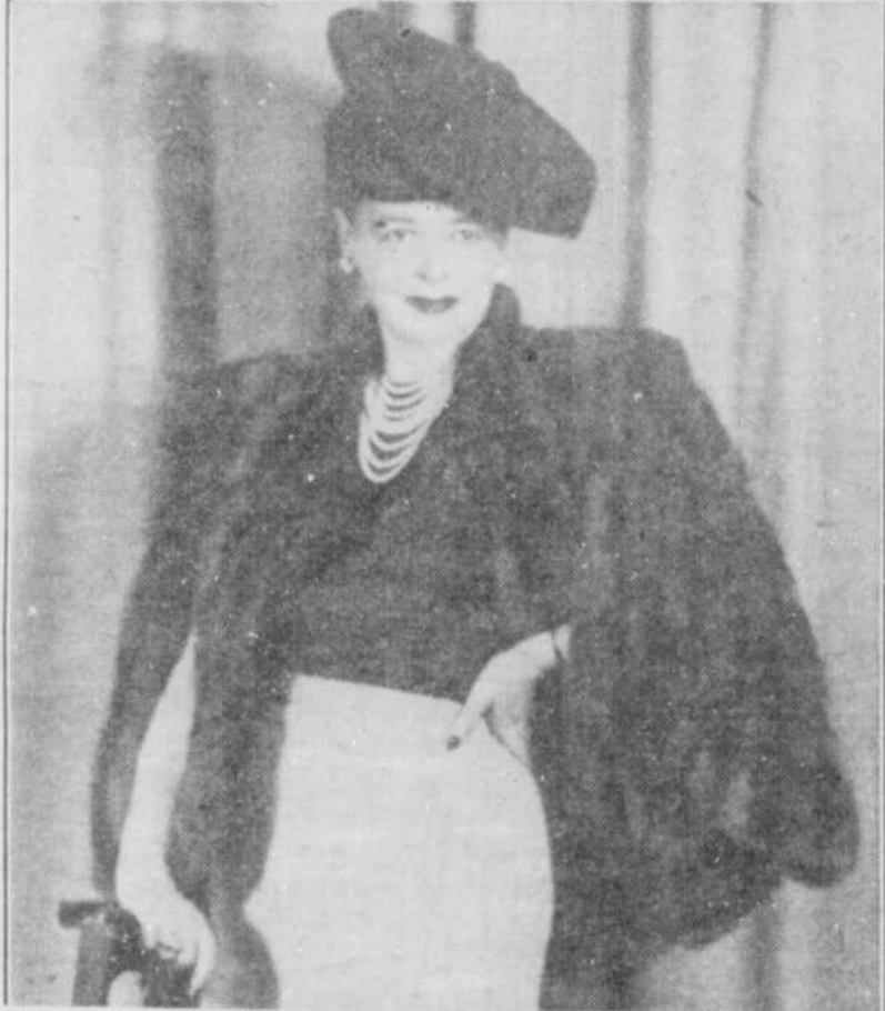
Cape d'écureuil de Russie, teinte zibeline