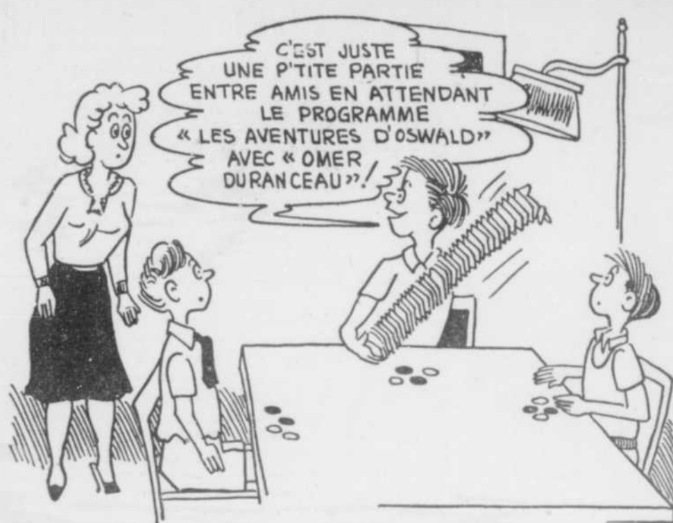
ÉCOUTEZ CKVL... VOUS PLEUREREZ D'AVOIR TROP RI !