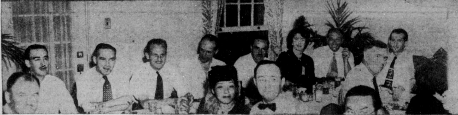
Quelques instants du tournoi de golf de la radio Golf Municipal. À gauche, le vainqueur du tournoi, le capitaine du club. À droite, le score de la journée. Dans le grand salon, les grands salons, remarque, assis...