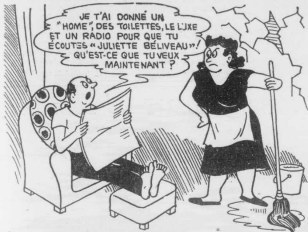
NOTRE GRANDE COMÉDIENNE DE RETOUR SUR LES ONDES DE CKAC.