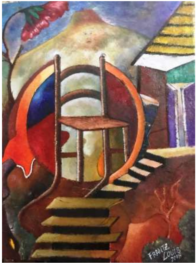
Frantz Louis - La chaise pleine d'histoires, huile sur toile, 16" x 20", 2018