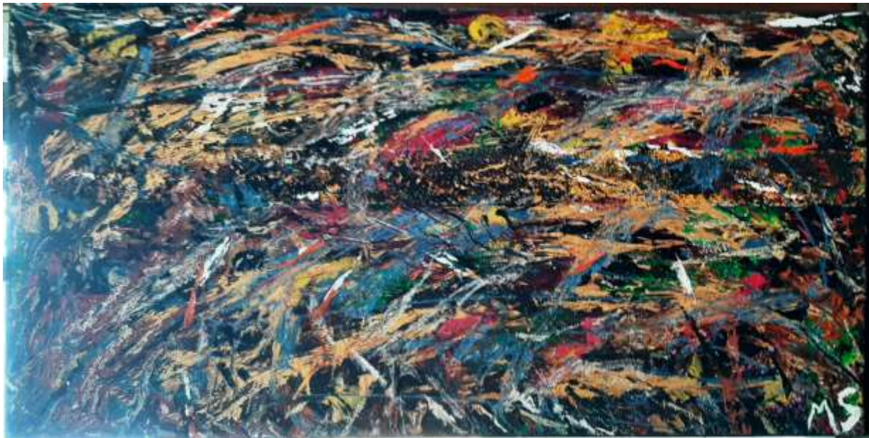
Malika Sellek - Beauté de la nature, acrylique sur toile, 24" x 12", 2019