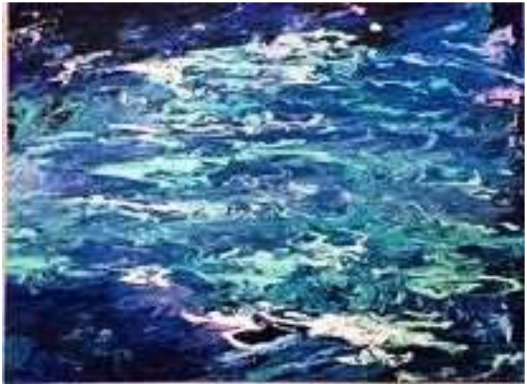
Ecaterina Litvin - Freedom, huile sur toile, 24" x 31"