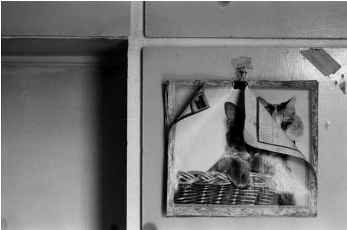
Jacques Pharand - Le calendrier, photo argentine, 8" x 12", 2021