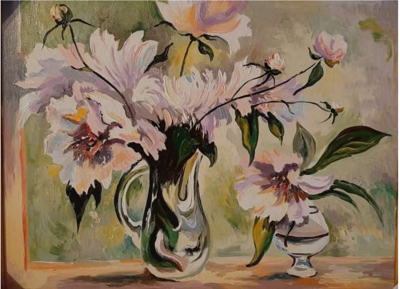
Elena Stolearova - La fleur étalée, huile sur toile, 12" x 16"