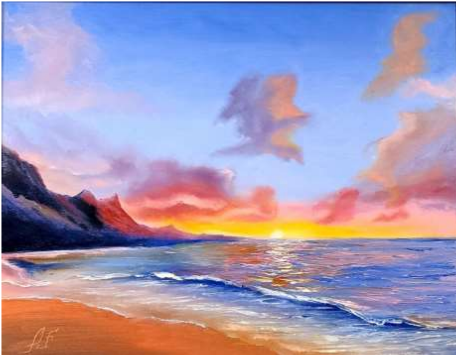
Arkady Fridlender – Sunset # 4, huile sur toile, 16" x 20", 2018