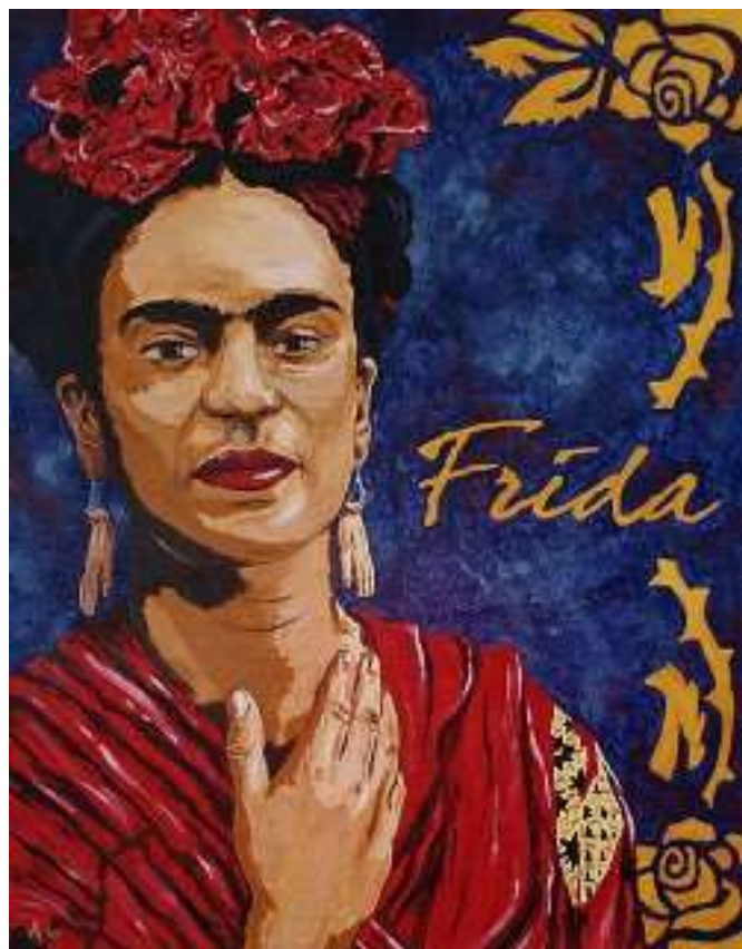
Angel Cruz – Frida Khalo, acrylique sur toile, 28" x 22"