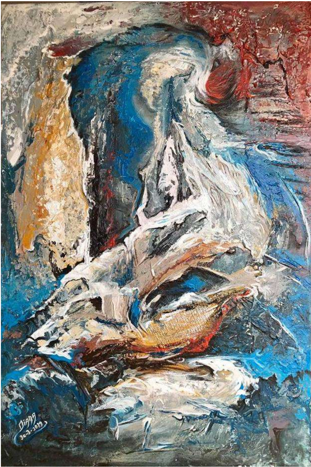
Diana Hourani Zeineddine – Paysage imaginaire, acrylique sur toile, 24" x 36", 2019