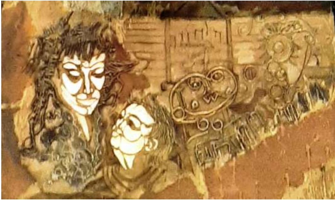
Eneida Hernandez –

Promenade 1, matrice estampe collagraphie sur plywood, 18" x 14", 1993