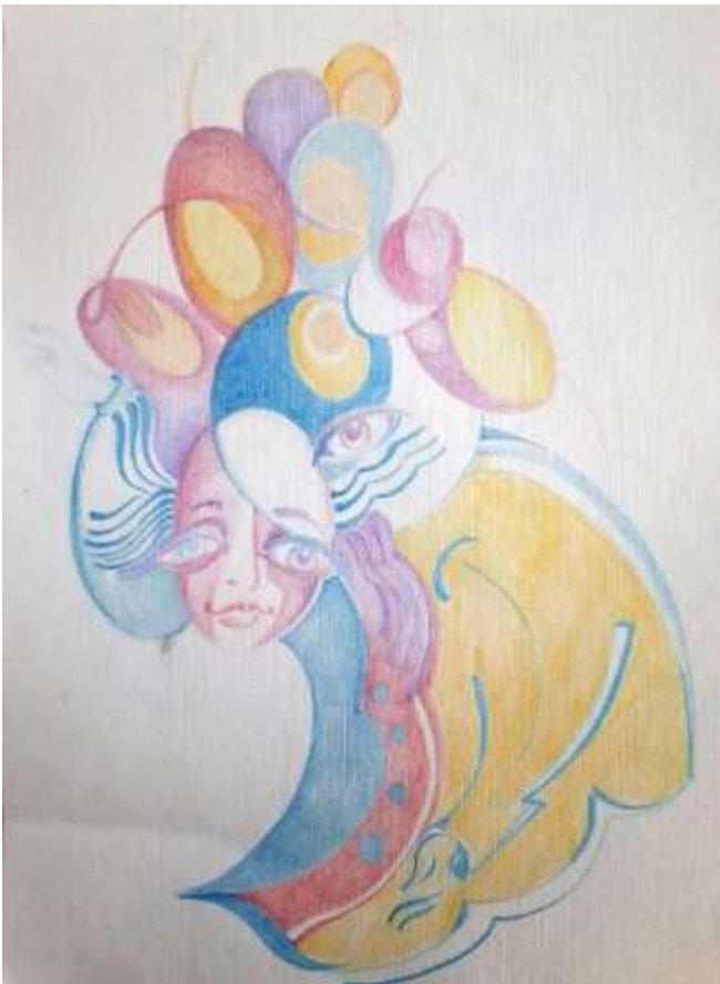
Alla Zagorodniuc-Scoarta - Le Cirque – le jongleur, crayons, médium utilisée pour l'acrylique, huile et polymère, 9" x 12", 2019