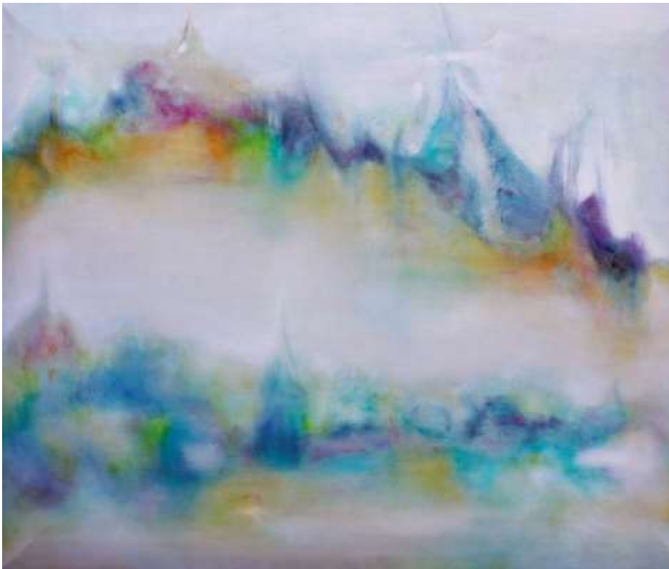
Li Shi - Soul Dwelling, oil painting on canvas, 27.2 x 33.2 inch, 2020