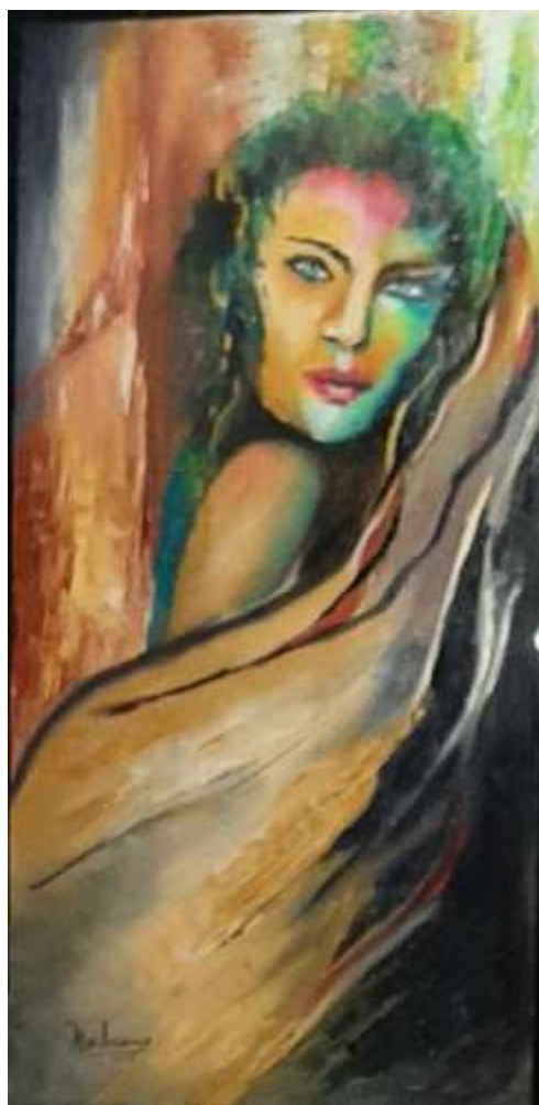
Marie-Lucienne Marcelin – Dans un jardin, huile sur toile, 12" x 24"