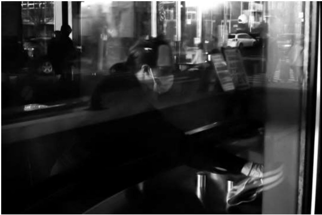
Jacques Pharand - Ménage, photo argentine, 8" x 12", 2021