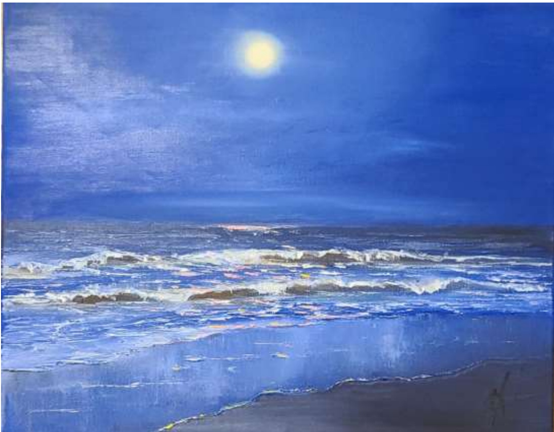
Arkady Fridlender - Lunar seascape # 5, huile sur toile, 16" x 20", 2018