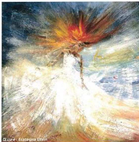
Œuvre : Ecaterina Dîvin