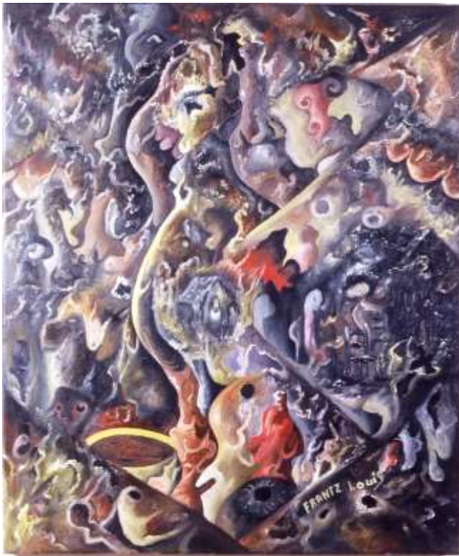
Frantz Louis - Profondeur de Neptune, huile sur toile, 20" x 24"