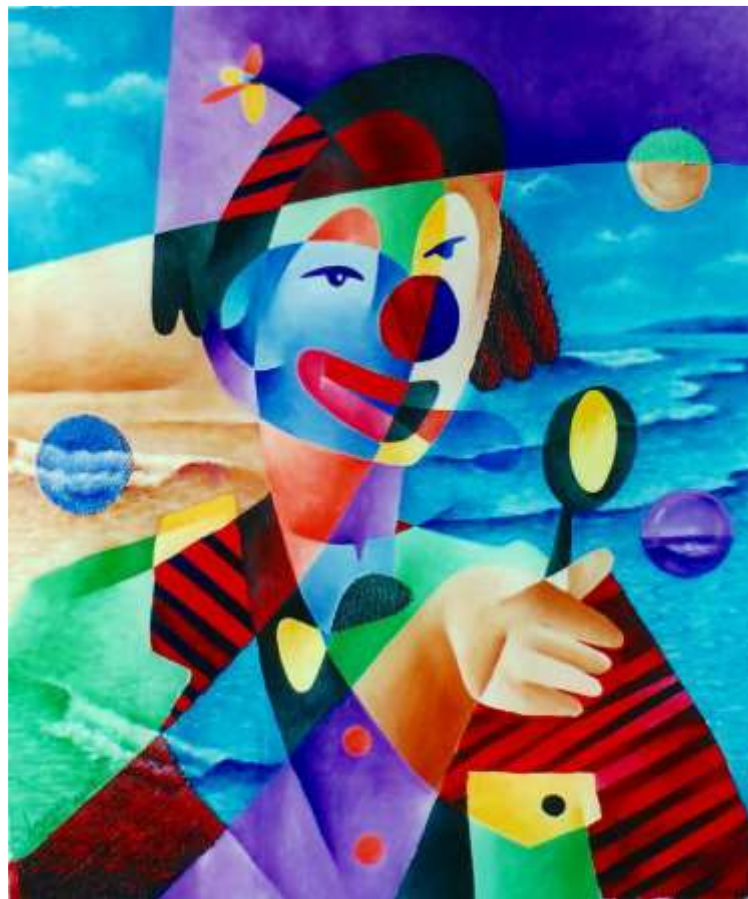
Luis Jacintho Argumedes Mateus - Un cirque à la plage # 2, acrylique sur toile, 20" x 24"