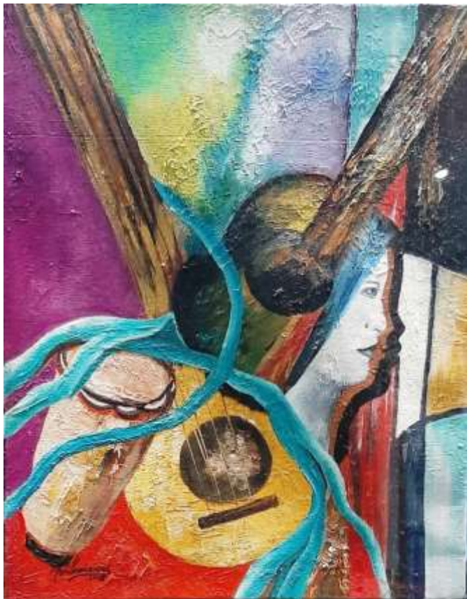
Marie-Lucienne Marcelin – Rêve et mandoline, huile sur toile, 16" x 20", 2016