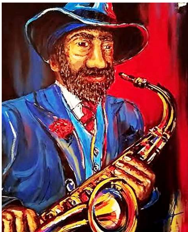
Angel Cruz – Sax en bleu, acrylique sur toile, 20" x 16"