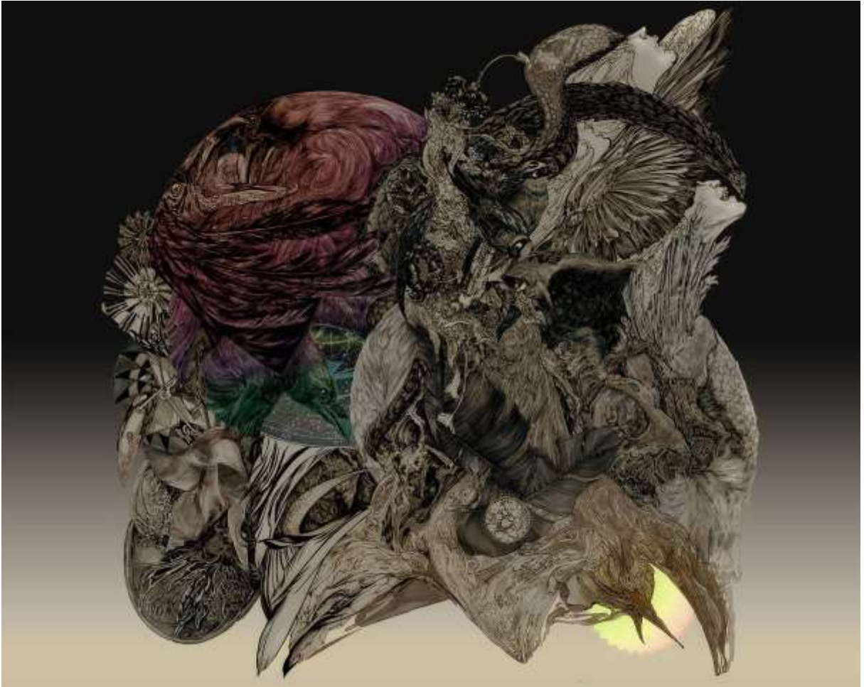
Dali Wu - It is always hard to ask their souls to stay behind, mixte média sur toile, 26" x 38"