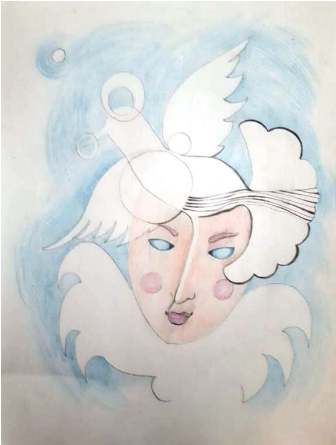
Alla Zagorodniuc-Scoarta – Cirque - Le magicien, crayons, médium utilisée pour l'acrylique, huile et polymère, 9" x 12"