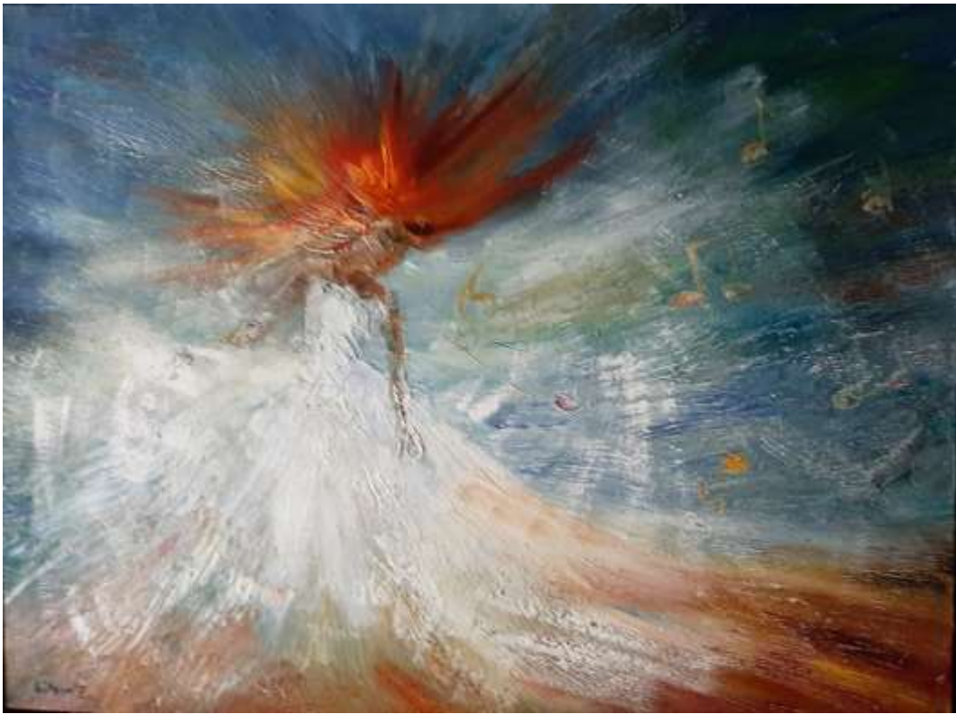
Ecaterina Litvin - The wind of sound, huile sur toile, 60 x 80cm, 24" x 30"