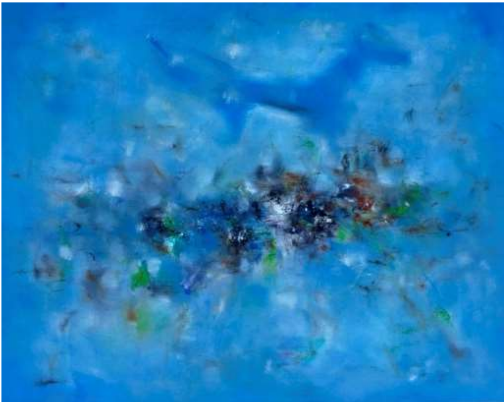
SHI LI - Dream of Childhood, oil painting on canvas, 24 x 30 inch, 2020