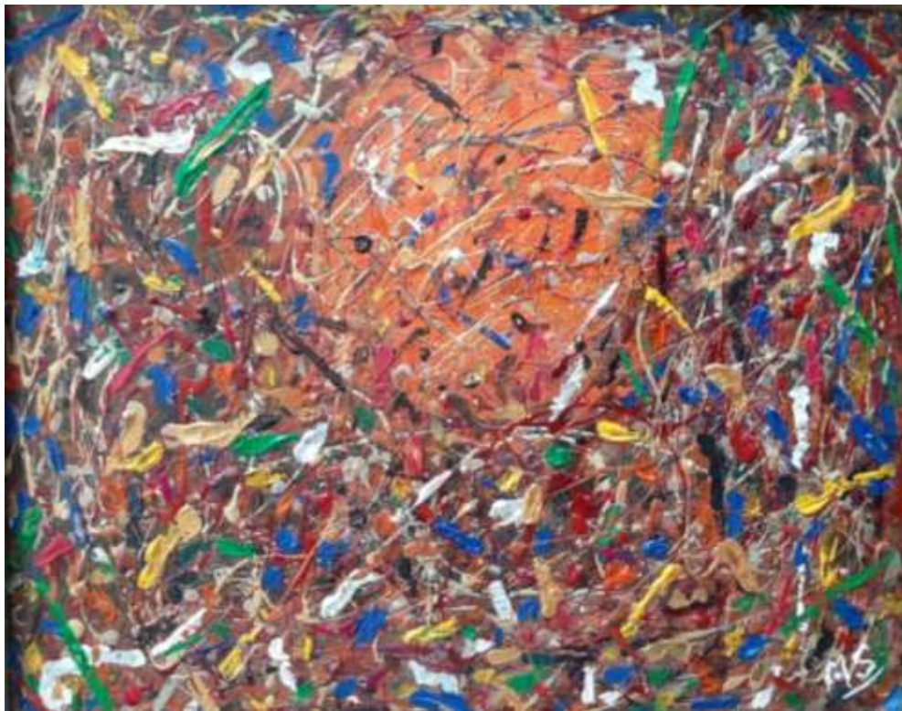
Malika Sellek - Coucher du soleil, acrylique sur toile, 24" x 12", 2019