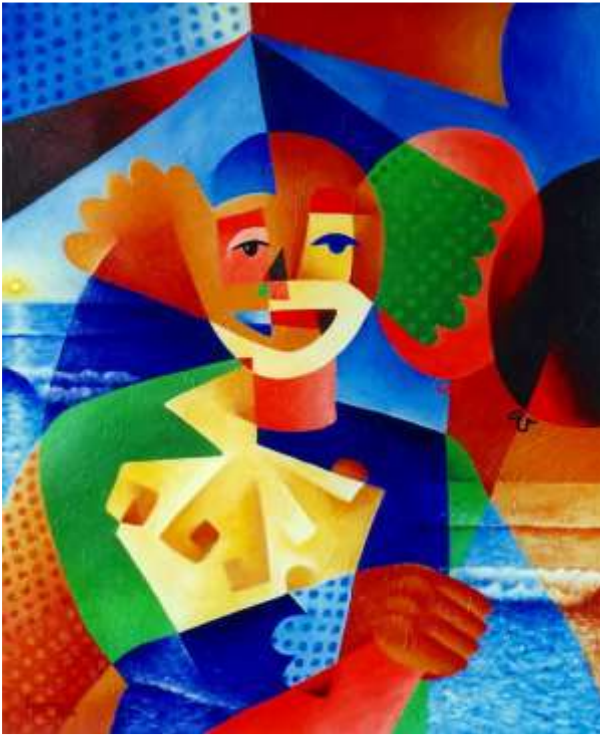
Luis Jacintho Argumedes Mateus - Un cirque à la plage # 1, acrylique sur toile, 20" x 24"