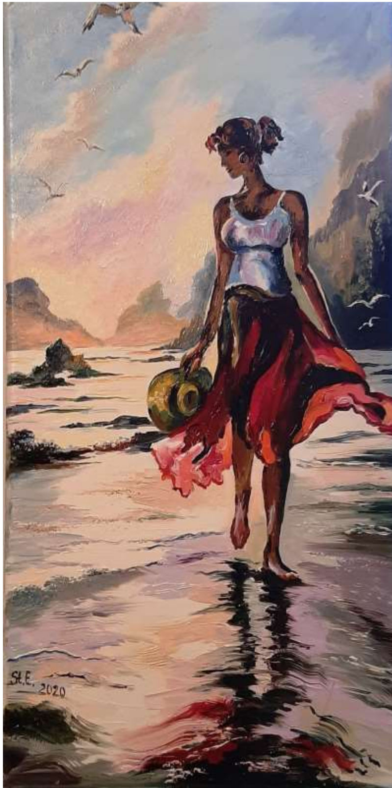
Elena Stolearova - Promenade au bord de l'eau, huile sur toile, 10" x 20"