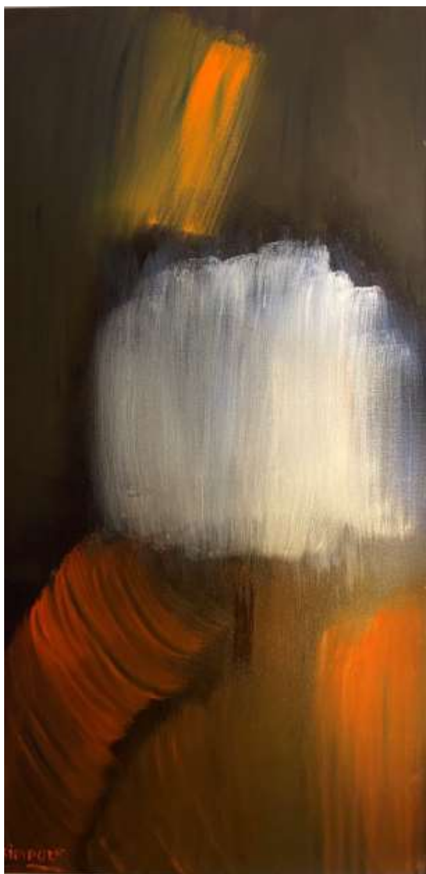
Kim Pov Eap - Aurore, huile sur toile, 20" x 40", 2020