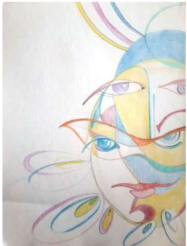
Alla Zagorodniuc-Scoarta - Le Cirque - Arlequin & Pierrot, crayons, médium utilisée pour l'acrylique, huile et polymère, 9" x 12", 2019