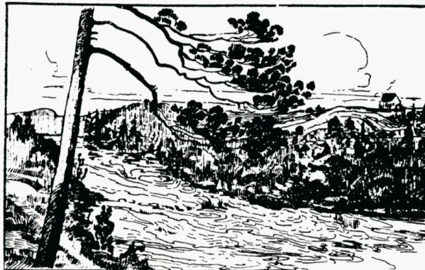
LA PÉRIBONKA À HONFLEUR