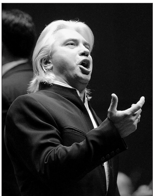
Dmitri Hvorostovsky en concert avec l'OSM hier soir.

Car la salle comble, c'est incontestable-