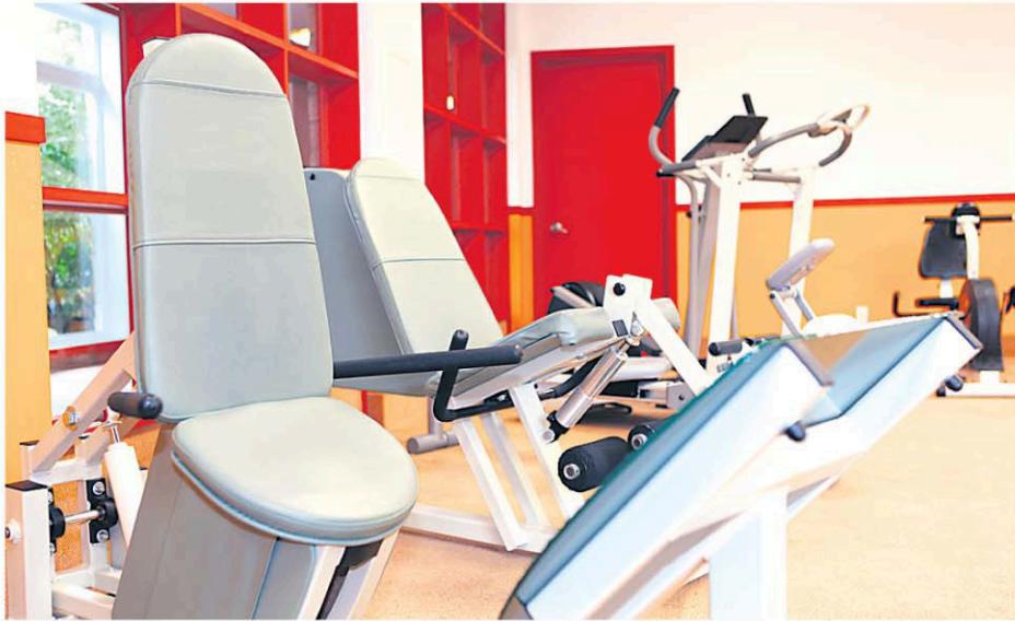
Une belle salle de conditionnement physique est accessible à tous les résidents de L'Eau Vive.

locataires pour des moments de lecture et de détente. Une salle de jeux comprend aussi jeu de palet (shuffleboard), tables de billard, table de Mississippi, jeux de poches, etc. Les plus contemplatifs peuvent finalement passer de très beaux moments dans nos magnifiques jardins aménagés à l'extérieur. La belle vie quoi!