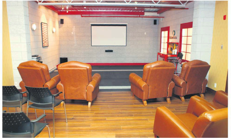
Envie de septième art? Une belle salle de cinéma maison vous promet des soirées plus qu'intéressantes!