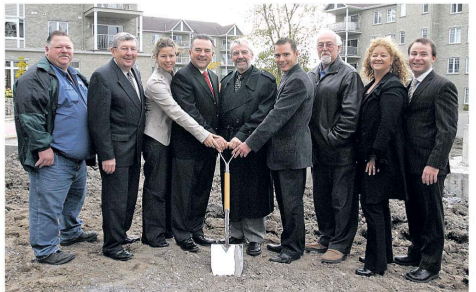
Première pelletée de terre pour la Phase 5, en 2006.

Aujourd'hui, L'Eau Vive emploie 56 personnes.