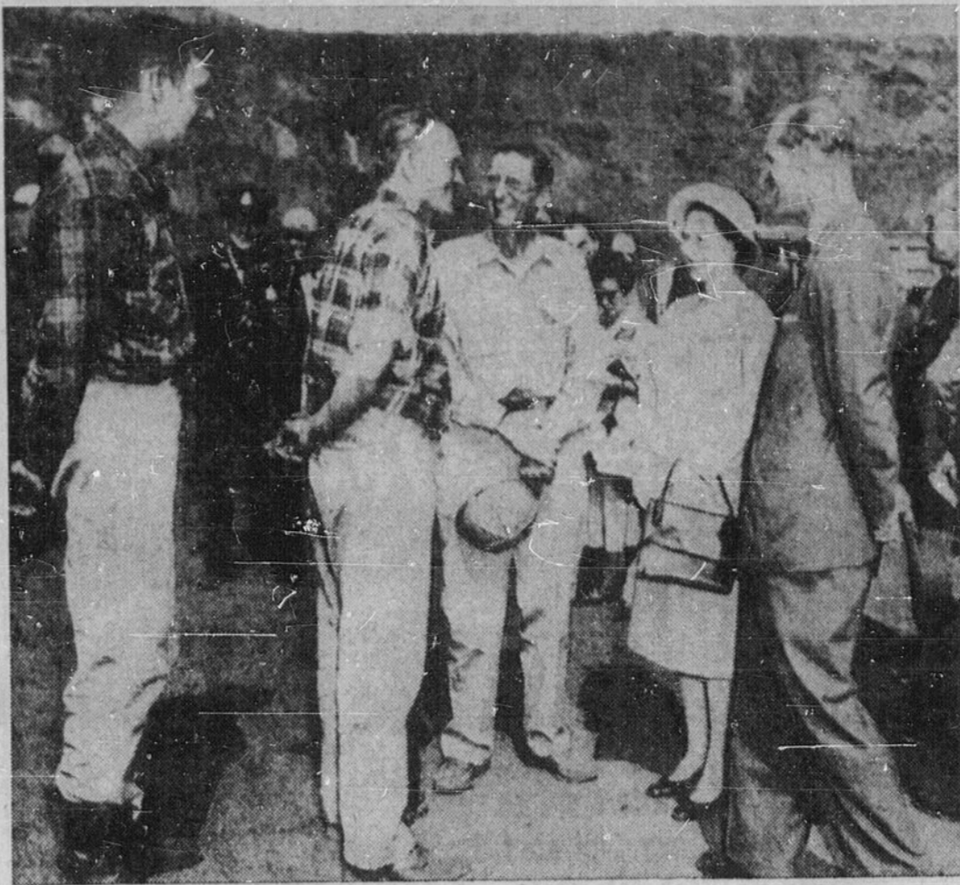
VISITE A UNE MINE DE FER — La reine Elisabeth et le prince Philippe ont eu une conversation amicale avec des mineurs au fond de cette mine à ciel ouvert. La mine Gagnon, de Schefferville, est creusée de 300 pieds. C'est samedi que le couple royal visitait cette ville de l'Ungava, dans la province de Québec.

CHICOUTIMI (PC) — Environ 400 conseillers en placement du Canada et des États-Unis sont arrivés vendredi à Chicoutimi à bord du paquebot Richelieu, afin d'effectuer une tournée des principaux centres industriels de la région au cours de la journée. Ils sont repartis pour Montréal samedi après avoir assisté à un banquet donné en leur honneur par la Chambre de Commerce de Chicoutimi.