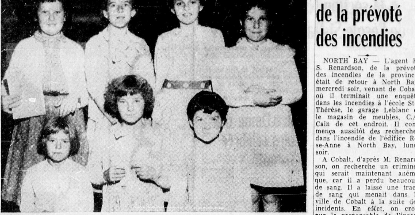
SEPT PETITES PORTEUSES DU DROIT — Lors d'une réunion des porteuses du Droit qui s'est tenue à Sudbury, une soixantaine de jeunes filles ont répondu à l'invitation du Bureau du journal à Sudbury.

JEUDI, 29 OCTOBRE 1959 — EDITION DU NORD — Treize